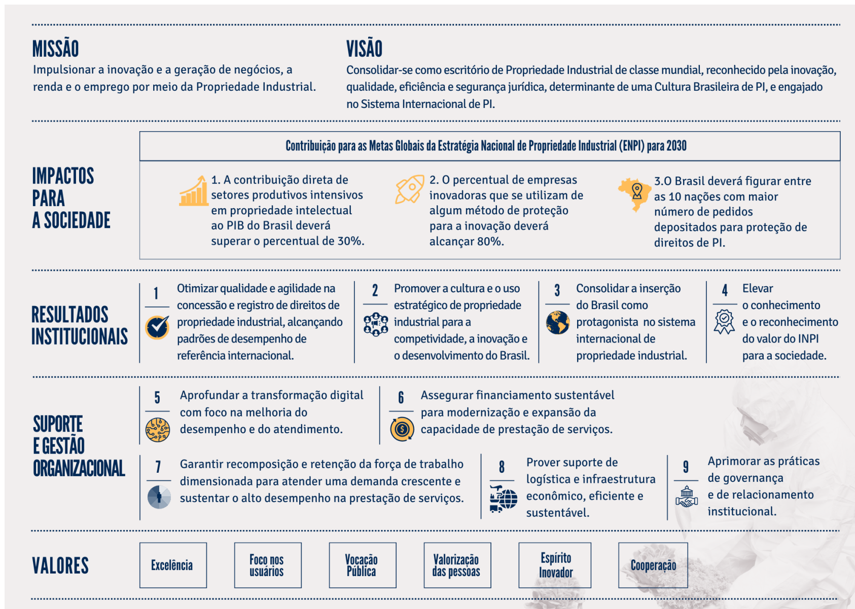
Figura 1 – Mapa Estratégico do INPI