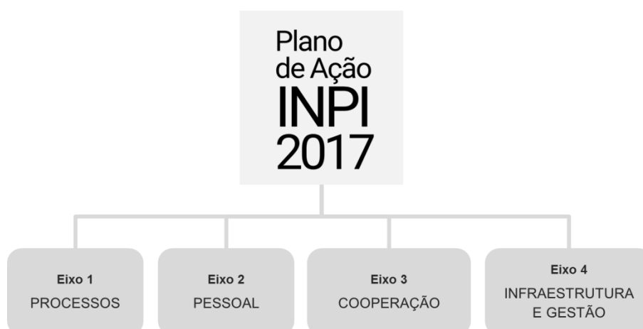
Figura 2: Eixos de ação

De modo a refletir as prioridades de ação que tem norteado a Administração do INPI desde o início do ano, são apresentadas iniciativas em diferentes situações de execução: em andamento, não iniciadas e concluídas em 2017. Parte das iniciativas possui horizonte plurianual de execução, tendo sido iniciadas em anos anteriores e/ou terão continuidade nos anos seguintes. As iniciativas prioritárias definem a agenda de entregas finais ou intermediárias para 2017.