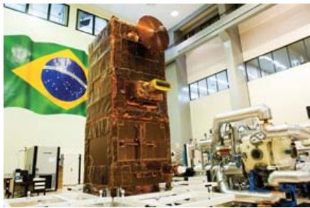
Amazonia 1 é o primeiro satélite produzido dentro da plataforma multimissão projetada no Inpe