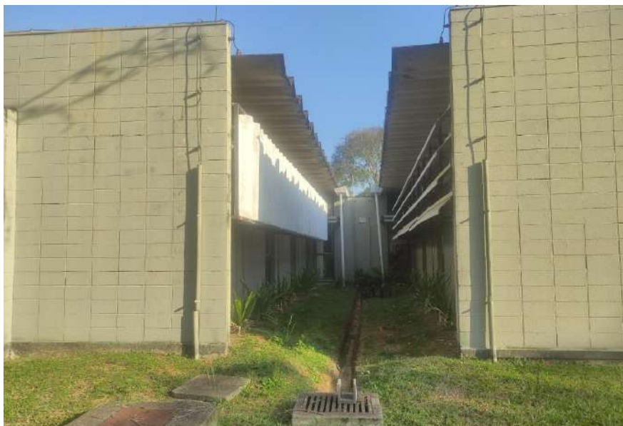
Foto externa de parte do prédio. Todas as salas têm conexão direta com a parte externa.

Este relatório apresenta fotos gerais do prédio onde serão executadas as atividades de instalação dos aparelhos de ar condicionado. As fotos mostram as partes existentes que deverão ser desmontadas para que se instalem os novos aparelhos.