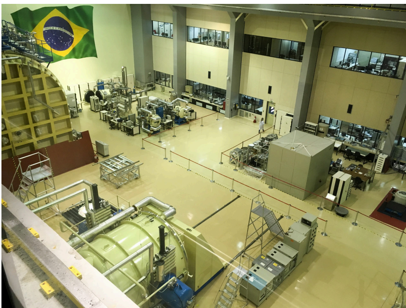
LIT - LABORATÓRIO DE INTEGRAÇÃO E TESTES