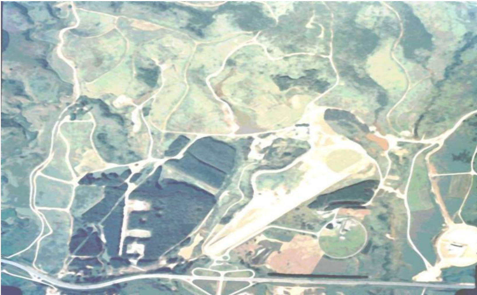
Cachoeira Paulista, SP