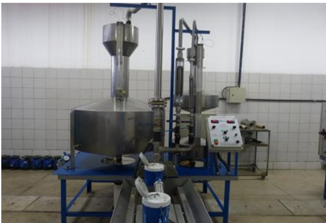
Foto Bancada: BANCADA MATERIALIZADA DE VOLUME - B.V.M. DN50/40- VECTOR