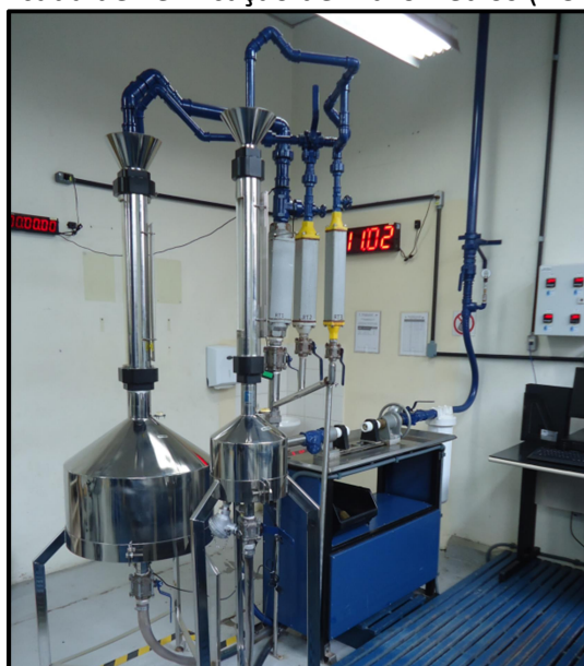
Figura A6 – Bancada de verificação de hidrômetros (BCVD01) do DMAE