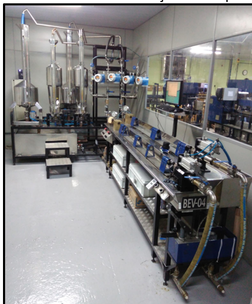
Figura A2 – Bancada de calibração da empresa SAGA