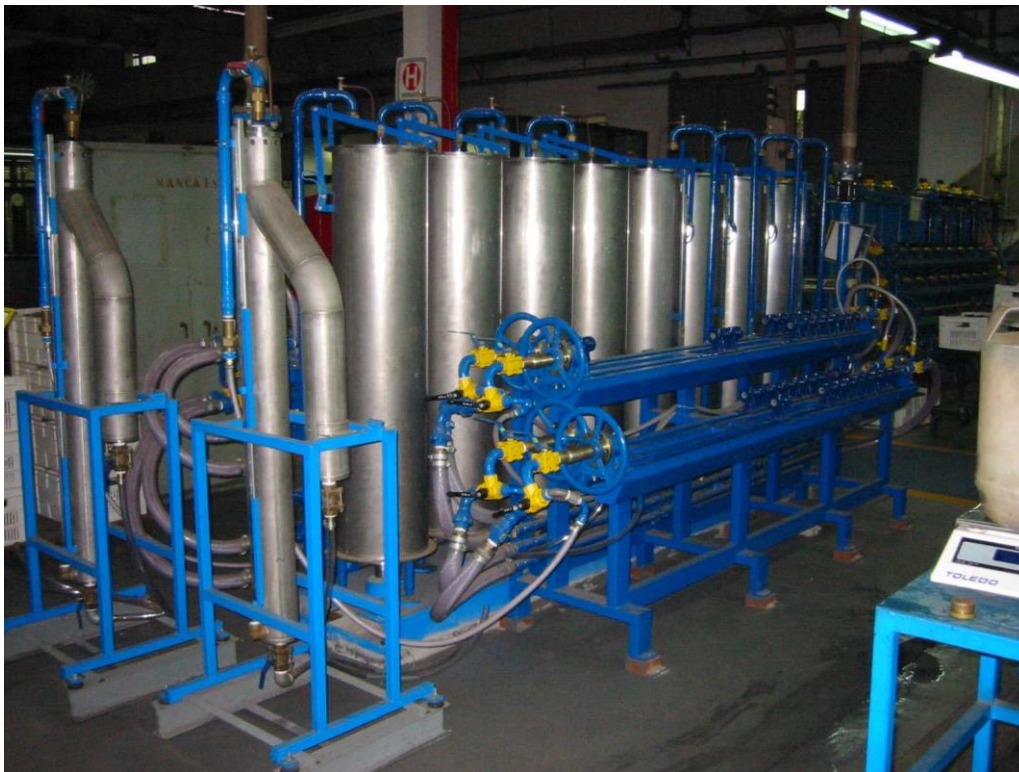
Figura A4 –Bancada de Calibração de Hidrômetros da Empresa - LAO

O Laboratório de verificação de medidores de água do Liceu de Artes e Ofícios de São Paulo - LAO recebeu do Inmetro a certificação ABNT NBR ISO/IEC 17025 e a partir de 27/05/2016 passou a fazer parte da Rede Brasileira de Laboratórios de Ensaios. A consulta referente à acreditação pode ser acessada através do no site do Inmetro, cujo endereço é: http://www.inmetro.gov.br/laboratorios/rble/ . O número da acreditação é: CRL 1041.