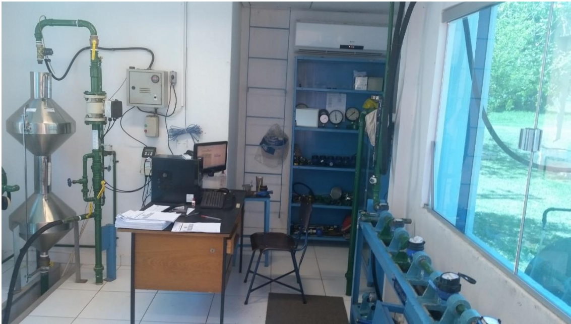
Figura A5 –Bancada de Calibração de Hidrômetros da Empresa - Saneago

O Laboratório de Hidrometria da SANEAGO encontra-se em processo de preparação para acreditação.