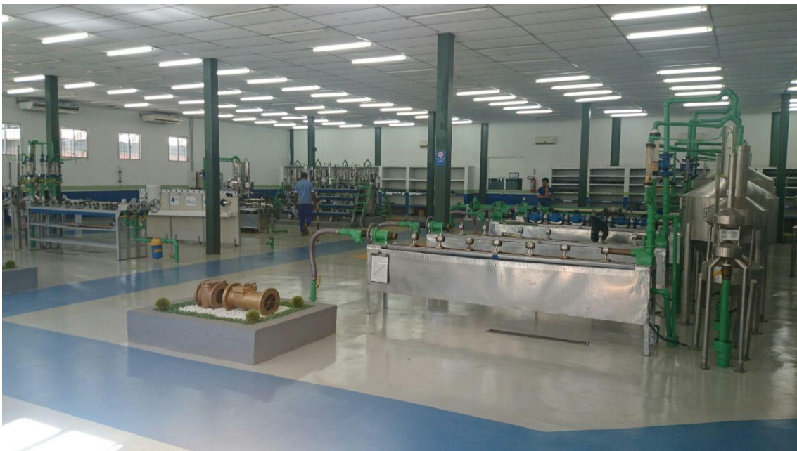
Figura A1 –Bancada de Calibração de Hidrômetros da Empresa - CEDAE

http://www.inmetro.gov.br/laboratorios/rble/ . O número da acreditação é: CRL 1083.