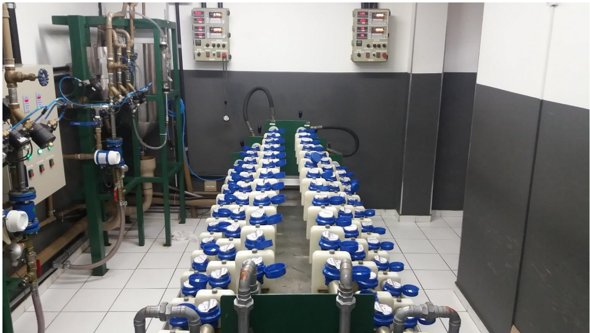
Figura A3 –Bancada de Calibração de Hidrômetros da Empresa - Hidrometer