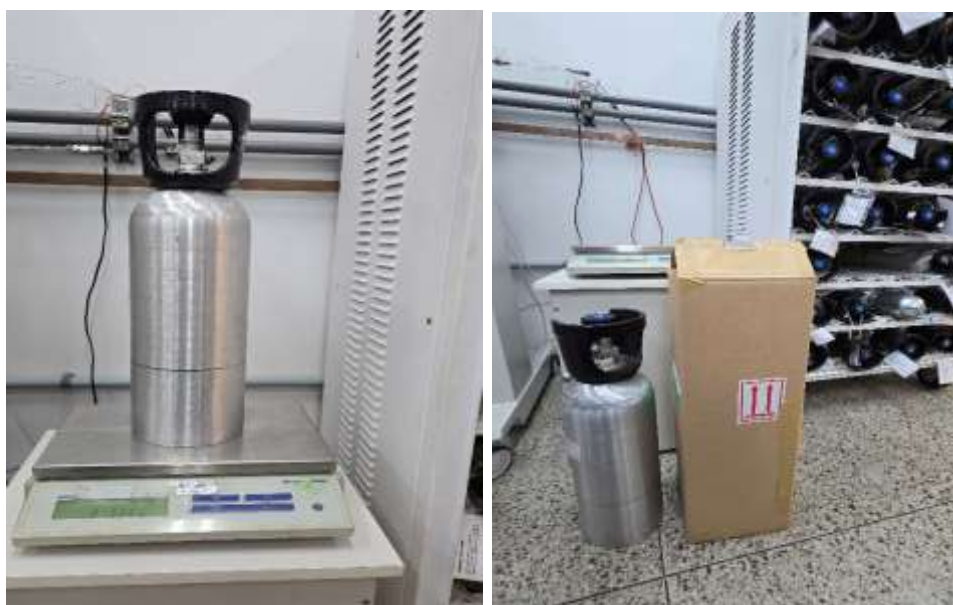
Figura 1 – Dimensões e peso do item de EP.

O item de EP será um cilindro com 60 cm altura x 14 cm de diâmetro e peso aproximado de 9 kg, a embalagem externa tem 70 de altura x 20 cm lateral x 20 cm de profundidade, conforme Figura 1.