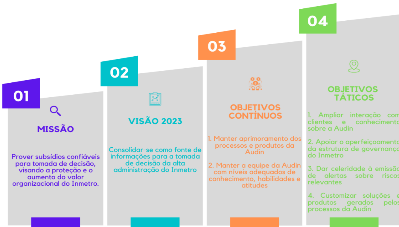
Figura 1 – Resumo Plano Tático Audin 2023-2025.

A Audin pautou sua atuação, no exercício de 2024, na missão, visão, e objetivos contínuos e táticos definidos no planejamento tático para o horizonte de 2023-2025, conforme apresentado na Figura 1: