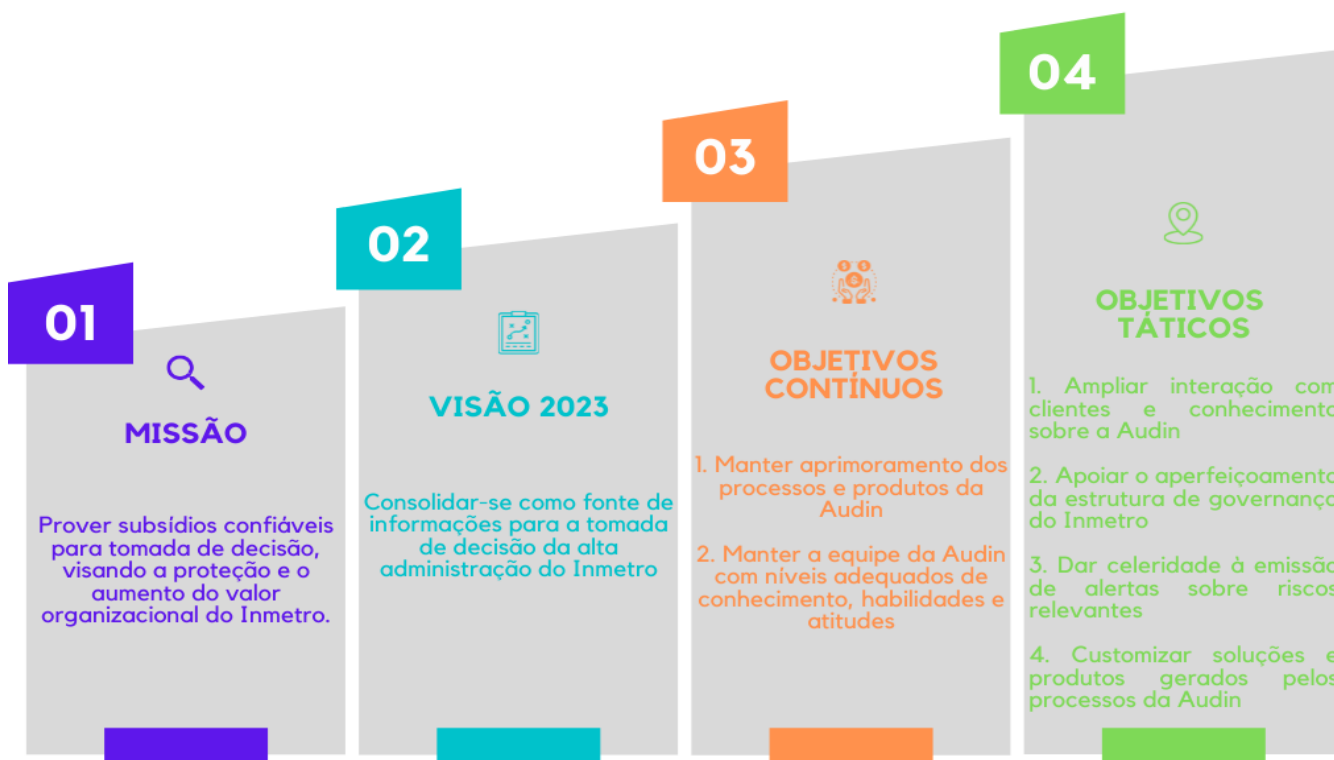
Figura 1 – Resumo Plano Tático Audin 2021/2023.

A Audin pautou sua atuação, no exercício de 2023, na missão, visão, e objetivos contínuos e táticos definidos no planejamento tático para o horizonte de 2021/2023, conforme apresentado na Figura 1: