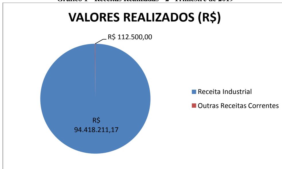
Gráfico 1 - Receitas Realizadas - 2º Trimestre de 2019