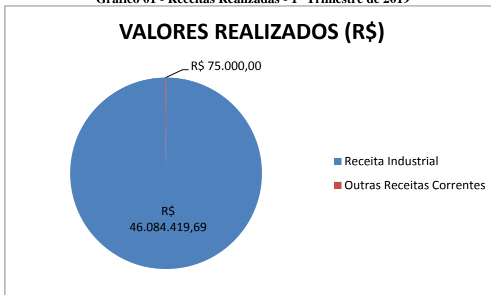
Gráfico 01 - Receitas Realizadas - 1º Trimestre de 2019