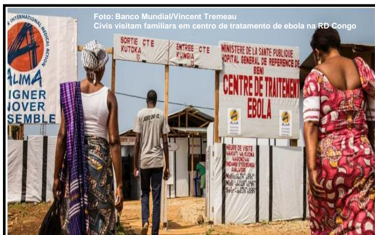
Civis visitam familiares em centro de tratamento de ebola na RD Congo

A República Democrática do Congo, RD Congo, declarou fim ao surto do vírus ebola na província de Kassai . A medida foi tomada após não se registrarem novos casos desde que o último doente recebeu alta do centro de tratamento, em 19 de outubro de 2025 . Embora o surto, iniciado em 4 de setembro , tenha sido declarado encerrado , as autoridades de saúde mantêm a vigilância para identificar e responder rapidamente a qualquer ressurgimento.