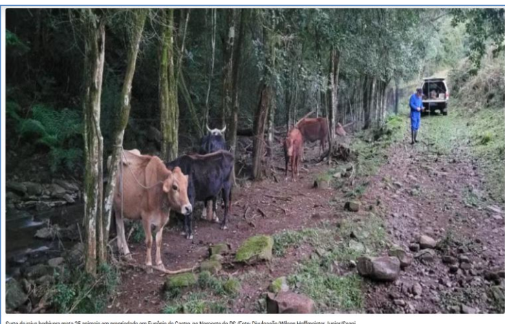
Surto de raiva herbívora mata 25 animais em propriedade em Eugênio de Castro, no Noroeste do RS.

Um surto de raiva herbívora foi registrado em uma propriedade na localidade de Rincão dos Antunes, em Eugênio de Castro, no Noroeste do RS. A doença causou as mortes de 24 bovinos e um equino.