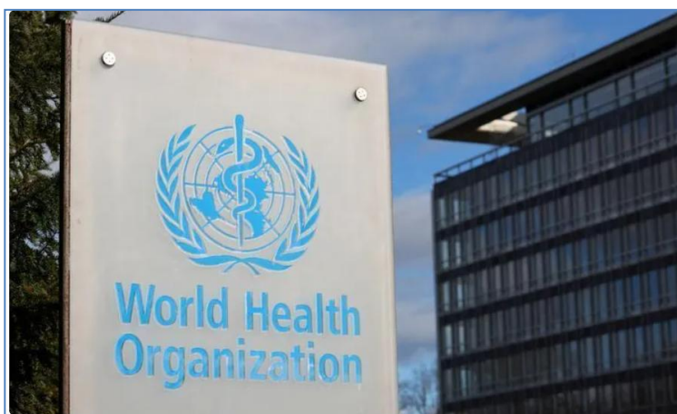
Sede da OMS em Genebra • 28/1/2025

Uma em cada seis infecções bacterianas confirmadas em laboratório é resistente a tratamentos com antibióticos, informou a Organização Mundial da Saúde (OMS) pedindo que os medicamentos sejam usados de forma mais responsável.