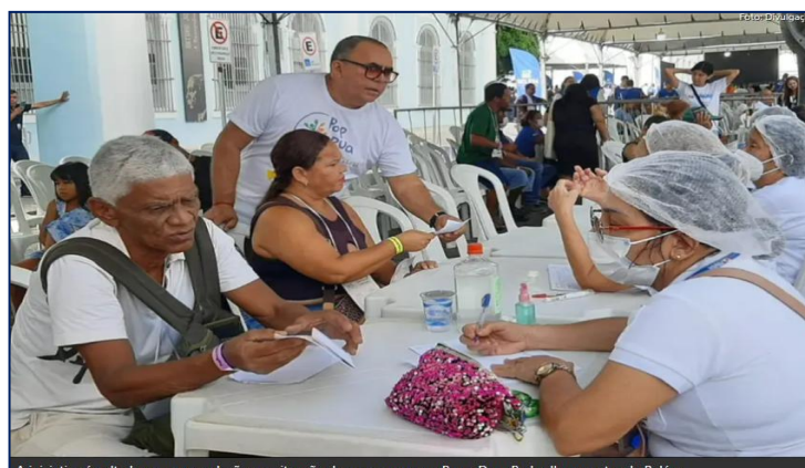
A iniciativa é voltada para a população em situação de rua e ocorre na Praça Dom Pedro II, no centro de Belém

Sespa leva serviços de saúde a pessoas em situação de vulnerabilidade social, em Belém.