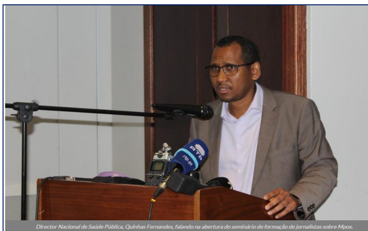
Director Nacional de Saúde Pública, Quinhas Fernandes, falando na abertura do seminário de formação de jornalistas sobre Mpox.

A Direcção Nacional de Saúde Pública confirma o registo de um cumulativo de 38 casos positivos de Mpox , confirmados laboratorialmente, desde a eclosão do surto, de 10 de Julho até 10 de Agosto de 2025.