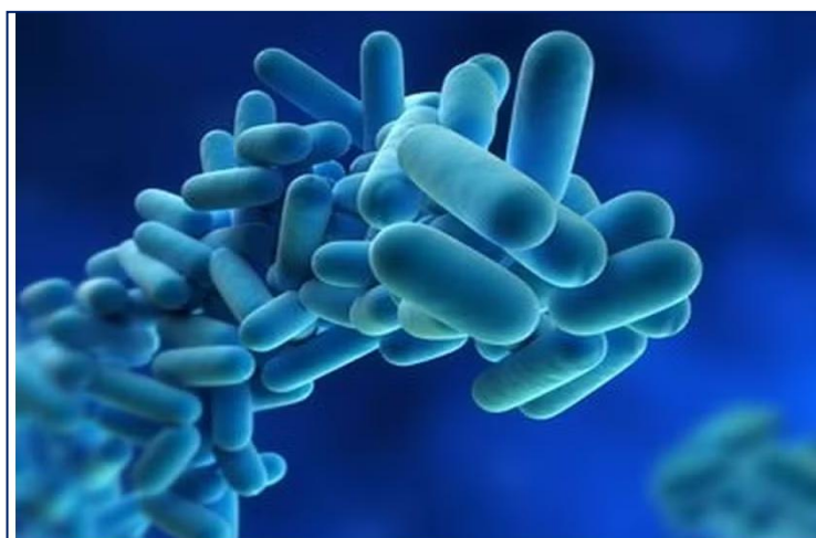
Surto da bactéria Legionella em famoso bairro de Nova York deixa três mortos e mais de 60 infectados

Três pessoas morreram e mais de 60 ficaram doentes em um surto crescente da chamada " doença dos legionários " no Harlem , popular bairro de Nova York, e as autoridades de saúde ainda procuram a fonte, mais de uma semana depois que as pessoas começaram a apresentar sintomas. Autoridades do departamento de saúde suspeitam que uma torre de resfriamento seja a culpada, porque os casos não estão confinados a um único prédio.