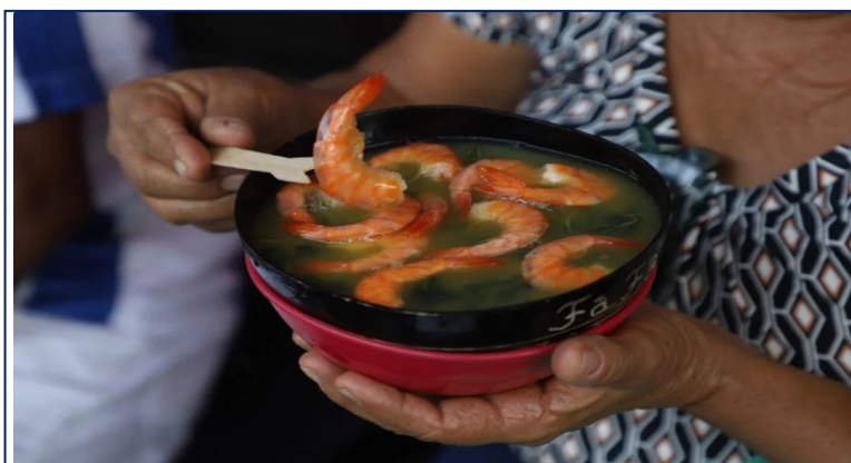
COP30: edital proíbe açaí, tucupi e maniçoba nos restaurantes oficiais, mas governo promete revogação

O edital de licitação para os restaurantes oficiais da COP30 , que ocorrerá em Belém em novembro de 2025 , proibiu a comercialização de pratos típicos da culinária paraense como açaí, tucupi e maniçoba . A medida gerou forte repercussão, especialmente entre autoridades e representantes culturais da região.