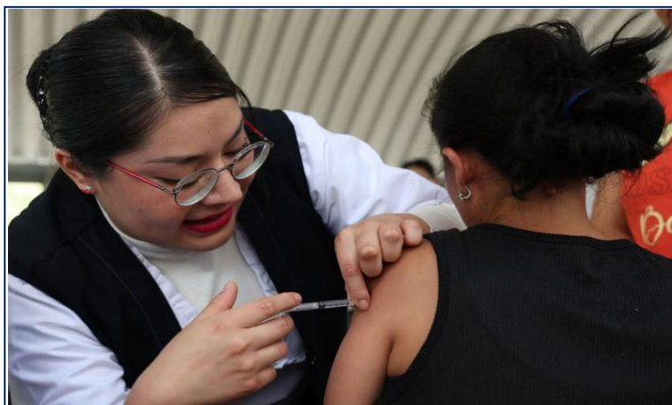
OPAS pede ação para preencher lacunas na imunização

A Organização Pan-Americana da Saúde (OPAS) pediu aos países das Américas que reforcem as atividades de vacinação , melhorem a vigilância de doenças e agilizem as intervenções de resposta rápida diante do aumento de casos de sarampo na Região. Até 8 de agosto de 2025, foram confirmados 10.139 casos de sarampo e 18 mortes relacionadas em 10 países , o que representa um aumento de 34 vezes em comparação com o mesmo período de 2024.