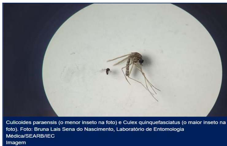
Culicoides paraensis (o menor inseto na foto) e Culex quinquefasciatus (o maior inseto na foto).