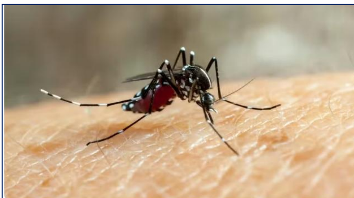
Mosquito transmissor da zika, Aedes aegypti

Zika: vacina brasileira é eficaz em camundongos e pode proteger contra complicações da doença.