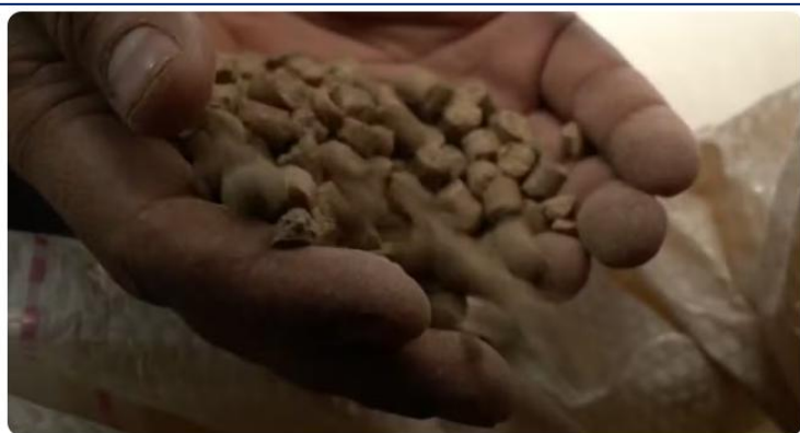
Contaminação inédita de ração causa a morte de ao menos 245 cavalos

Em caso inédito, ração tóxica causa a morte de ao menos 245 cavalos, diz Ministério da Agricultura.