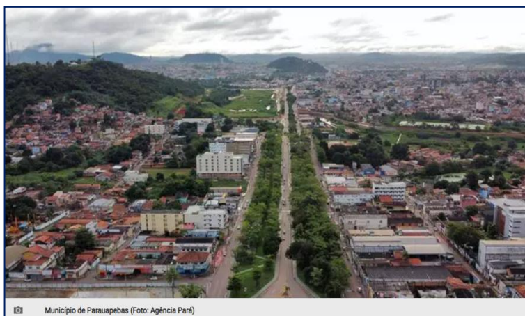
Município de Parauapebas

Nesta quinta-feira (10), o município de Parauapebas registrou dois tremores de terra . A região, que fica no sudeste do Pará , foi atingida por dois abalos com apenas 10 horas de diferença , segundo informações da Rede Sismográfica Brasileira (RSBR).