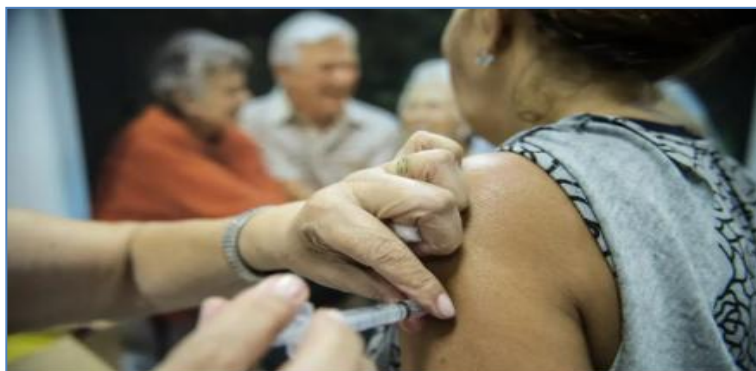
Dia D de vacinação ocorreu em 10 de maio

Campanha nacional contra a gripe vacinou 1,5 milhão de pessoas em um único dia.