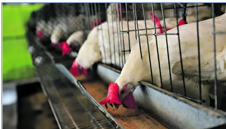
O Pará ocupa a 11ª posição na produção de frango de corte no Brasil, distribuída em 267 granjas no Estado

O material coletado no último dia 19 de maio, no município de Eldorado dos Carajás , deu resultado negativo para Influenza Aviária e Doença de Newcastle , infecções respiratórias que acometem aves silvestres e domésticas. A Agência de Defesa Agropecuária do Estado do Pará ( Adepará ) realizou três procedimentos padrões referentes à investigação clínica e epidemiológica de síndrome respiratória e nervosa das aves em propriedades de subsistência e encaminhou para o laboratório federal de defesa agropecuária do Ministério de Agricultura e Pecuária ( LFDA-MAPA ). A agência aguarda o resultado das outras duas amostras (outra de Eldorado dos Carajás e uma de Abel Figueiredo).