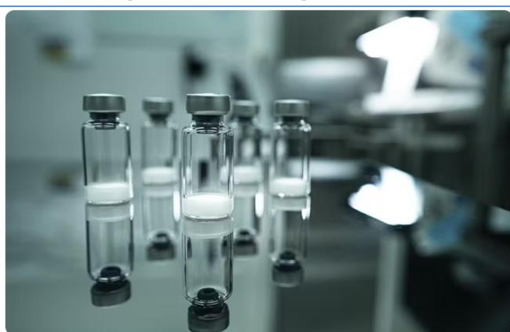
Vacinas de gripe aviária são estocadas em ao menos dez países.

Cerca de 20 vacinas contra H5N1, o vírus da gripe aviária , foram licenciadas pelo mundo. Os imunizantes têm caráter emergencial e estão estocados em pelo menos dez países . As 20 vacinas foram licenciadas por autoridades reguladoras de países como Estados Unidos, Canadá, China, França, Bélgica e Finlândia. Até setembro de 2024, no entanto, apenas a Finlândia havia implementado um programa de vacinação contra gripe aviária direcionado a grupos de risco. O Instituto Butantan, do Brasil , também já produziu uma vacina. Agora, aguarda autorização da Anvisa (Agência Nacional de Vigilância Sanitária) para testá-la em humanos.