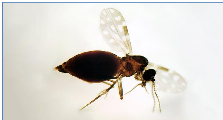
O tamanho pequeno é uma característica marcante do maruim, que mede cerca de 1,5 mm.

Brasil tem alta de casos de febre Oropuche.