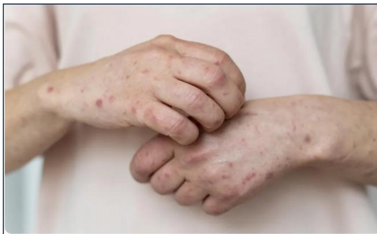
Registro de caso de Mpox

O Amazonas registrou um aumento nos casos confirmados de Mpox , que subiram de 33 para 35 segundo boletim divulgado nesta quarta-feira (7) pela Fundação de Vigilância em Saúde ( FVS-RCP ). Desde 1º de janeiro até 7 de maio de 2025, foram notificados 94 casos suspeitos da doença, com 40 descartados e um ainda em investigação. Até o momento, não há registro de mortes . A Secretaria de Estado de Saúde (SES-AM) orienta que pessoas com sintomas como febre, cansaço intenso e lesões na pele procurem a Unidade Básica de Saúde (UBS) mais próxima.