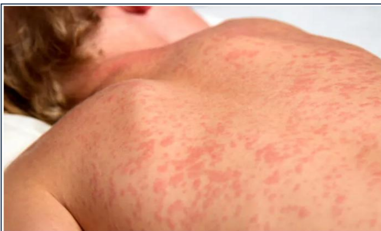
Cinco casos foram confirmados no Brasil neste ano

Em novembro de 2024, o Brasil recuperou o certificado de eliminação do sarampo , perdido em 2019 após um surto da doença no país. No entanto, novos casos começaram a surgir, acendendo o alerta entre as autoridades de saúde . Apenas nos quatro primeiros meses deste ano, 416 casos suspeitos foram notificados e cinco confirmados ( Ministério da Saúde ). Em todo o ano passado, foram registradas 2.260 suspeitas, com o mesmo número de confirmações. Até o momento, os casos registrados são considerados pontuais, sem mortes associadas.