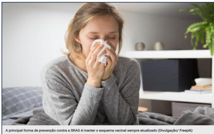
A principal forma de prevenção contra a SRAG é manter o esquema vacinal sempre atualizado

Pará registra mais de 1,5 mil casos de síndrome respiratória aguda grave em 2025.