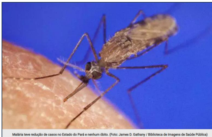
Malária teve redução de casos no Estado do Pará e nenhum óbito.

Pará reduz 37% os casos de malária nos primeiros meses de 2025.