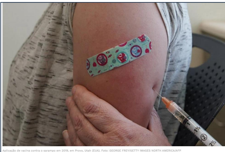
Aplicação de vacina contra o sarampo em 2019, em Provo, Utah (EUA).

O surto de sarampo nos Estados Unidos superou os mil casos confirmados, com três mortes registradas até o momento (AFP).