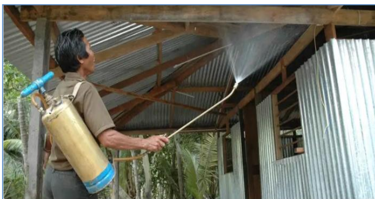
Um trabalhador borrifa inseticida nas superfícies de um abrigo para controlar a propagação de mosquitos e diminuir o risco de malária

Por ocasião do Dia Mundial da Malária , o Ministério da Saúde divulgou que os casos comprovados da doença caíram 26,8% entre janeiro e março deste ano na comparação com o mesmo período do ano passado. Ainda assim, foram 25.473 registros em apenas três meses .