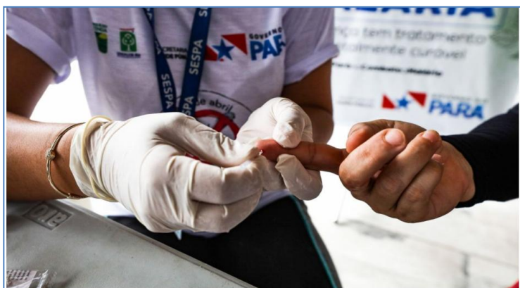
Sespa alerta para o controle de casos de malária

O Dia Mundial de Luta Contra a Malária (25 de abril), tem como objetivo aumentar a conscientização sobre a prevenção a essa doença. A Secretaria de Estado de Saúde Pública ( Sespa ) alerta à população sobre a importância de combater a ação dos insetos transmissores da doença.