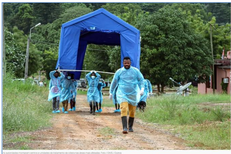
As autoridades montaram centros e unidades de tratamento de cólera nas áreas mais afetadas.

Mais de 14.000 casos de cólera e 505 mortes foram relatados desde o início do surto em janeiro de 2025 , com 50% dos casos envolvendo pessoas com menos de 20 anos . Segundo a Organização Mundial da Saúde ( OMS ) o surto de cólera em Angola já afetou 17 das 21 províncias do país.