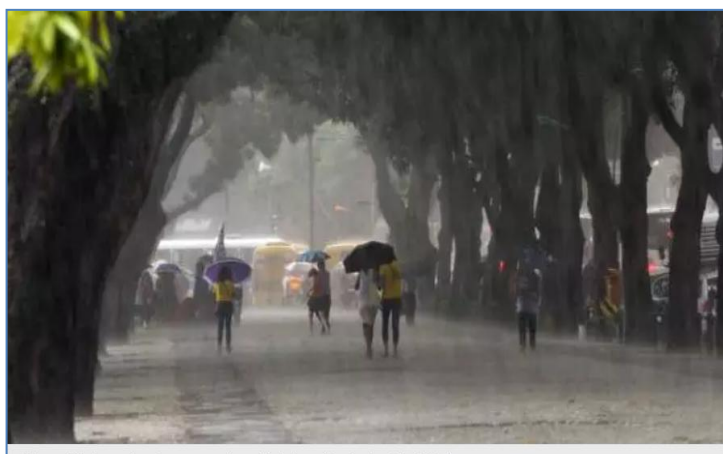
Maio deve ter chuvas intensas, segundo previsão do Inmet.

Previsão para o final de abril: Belém deve continuar registrando pancadas de chuva ao longo dos próximos dias de abril , com previsão de que o mês feche com índice pluviométrico próximo à média histórica de 405,6 mm .