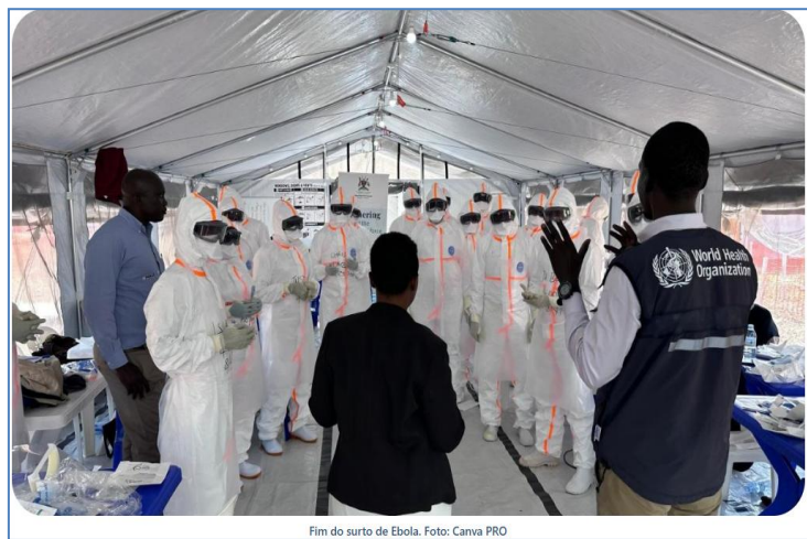
Fim do surto de Ebola.

É declarado o fim do surto de ebola em Uganda após 42 dias sem novos casos. Desde a confirmação dos primeiros casos em janeiro, a situação foi acompanhada de perto para evitar uma propagação ainda maior da doença ( Organização Mundial da Saúde - OMS e autoridades locais de saúde).