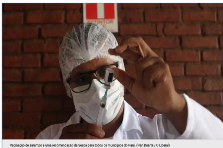
Vacinação de sarampo é uma recomendação da Sespa para todos os municípios do Pará.

A Secretaria de Estado de Saúde Pública ( Sespa ) emitiu um alerta epidemiológico aos municípios do Pará para reforçar a importância da atualização do cartão de vacinação contra o sarampo . A doença, altamente transmissível, pode afetar tanto crianças quanto adultos. A vacina tríplice viral , disponibilizada gratuitamente pelo Sistema Único de Saúde ( SUS ), também protege contra rubéola e caxumba. O aviso da Sespa segue recomendação do Departamento do Programa Nacional de Imunizações do Ministério da Saúde, devido à reintrodução do sarampo no Brasil em 2024.