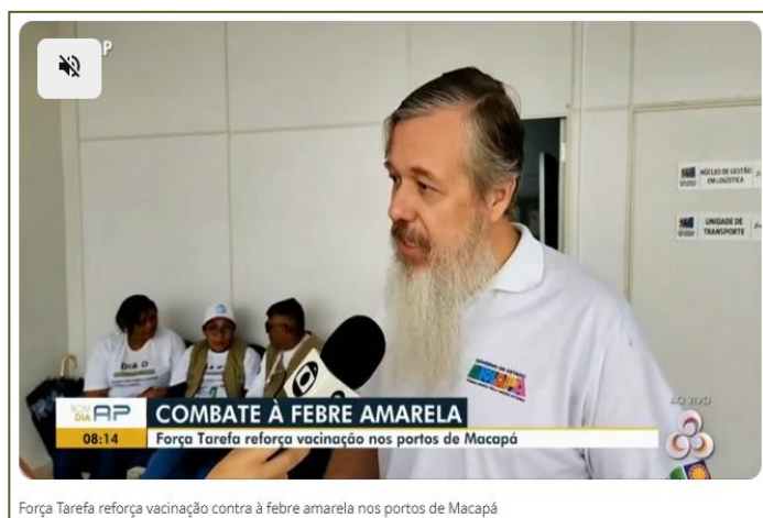
Força Tarefa reforça vacinação contra à febre amarela nos portos de Macapá

Amapá tem 12 casos confirmados e 2 mortes por febre amarela em 2025; SVS monitora.