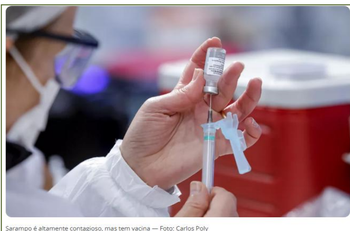
Sarampo é altamente contagioso, mas tem vacina

Região Europeia registra maior número de casos de sarampo em mais de 25 anos, diz OMS.