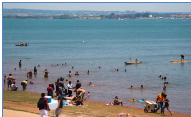
Ministério da Saúde alerta para cuidados

Ministério da Saúde (MS) alerta para aumento de mortes por afogamento no Brasil.