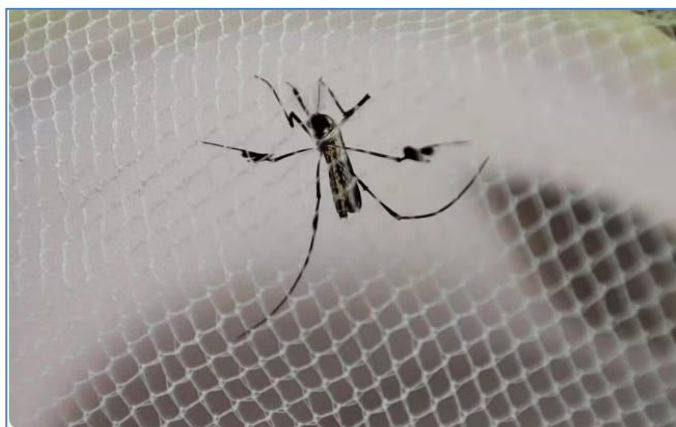
Febre amarela é uma doença infecciosa febril aguda, causada por um vírus transmitido por mosquitos infectados.

Morte de homem por febre amarela é a 1ª da história de São Pedro, e prefeitura anuncia vacinação no Carnaval.