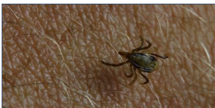
Febre maculosa continua a deixar mortos no Brasil

A febre maculosa, conhecida como doença do carrapato , continua preocupando autoridades. Minas Gerais confirmou a quinta vítima fatal da doença neste ano. Segundo a Secretaria de Estado da Saúde, foi uma mulher de 64 anos, residente em Caratinga . Ao todo, são 29 casos confirmados no Estado.