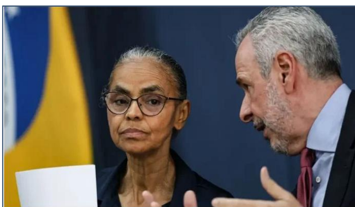
Delegados e observadores se reúnem nesta segunda e terça-feira

Ao menos 162 países estarão presentes na Conferência do Clima da ONU , que será realizada em novembro, em Belém (PA). O número ultrapassa o quórum mínimo necessário para que negociações e acordos internacionais sejam formalmente validados durante o encontro.