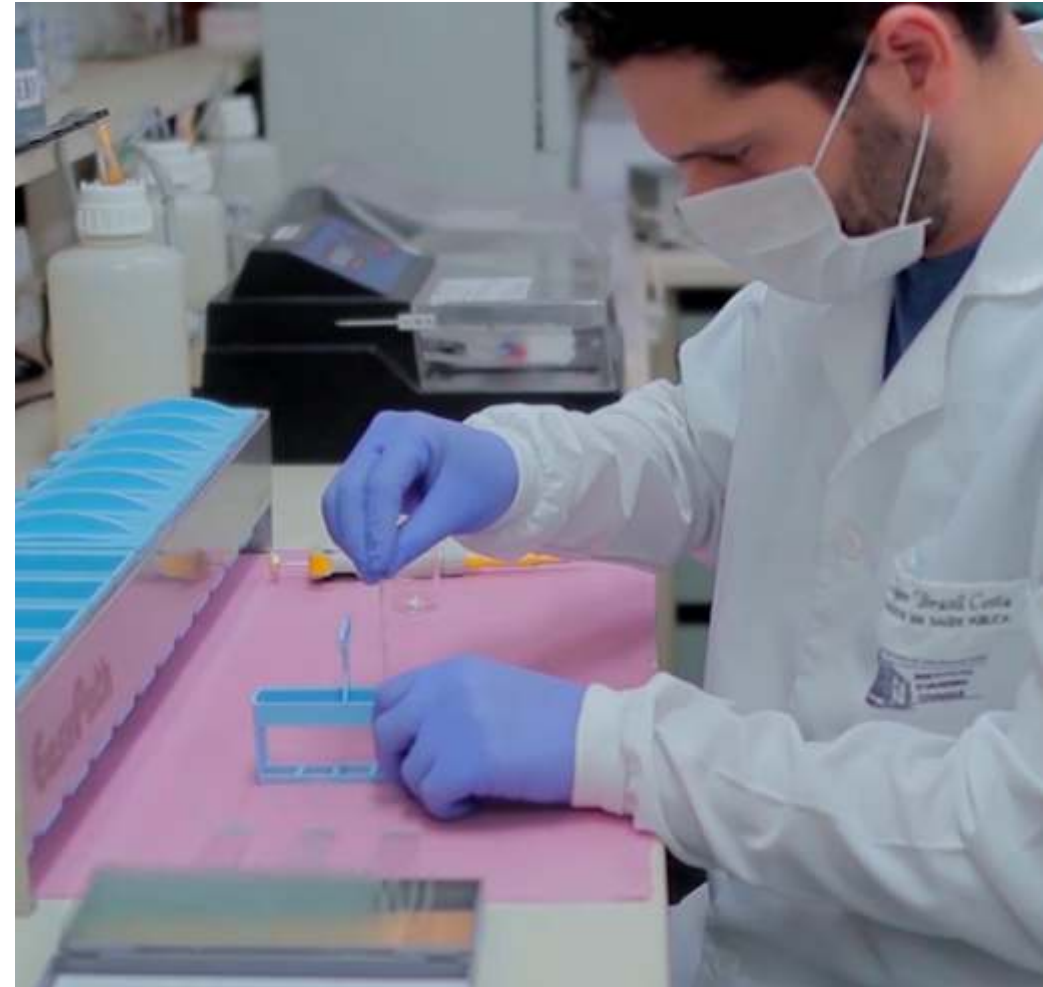
Figura4. Os processos de Integridade Pública fazem parte da base para o desenvolvimento das pesquisas científicas.