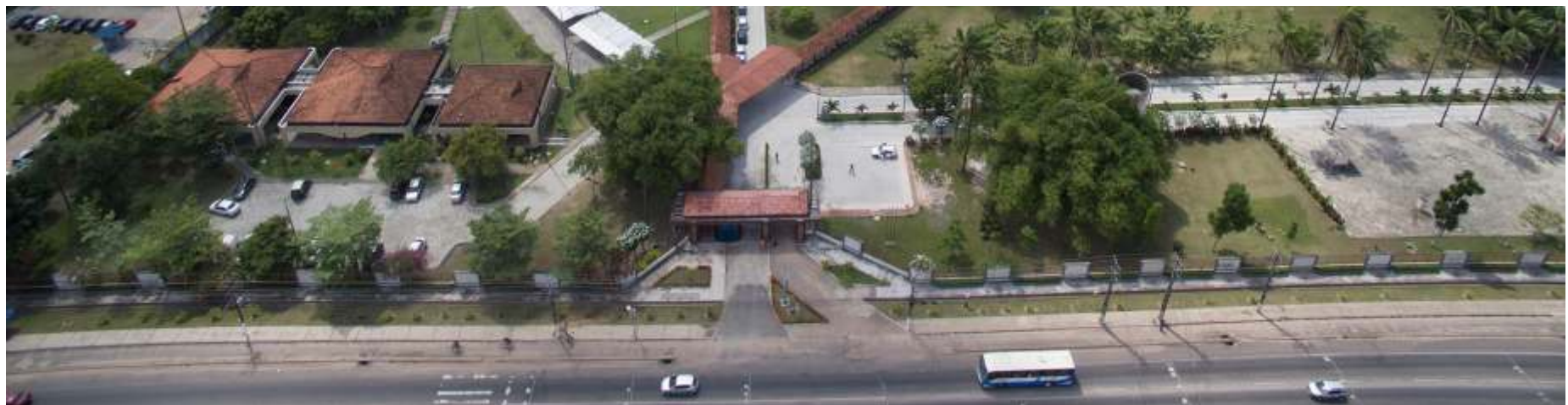
Figura 1. Portal de entrada para o Campus Ananindeua do IEC.

Desta forma, o IEC, alinhado ao Plano de Integridade do MS, torna público suas ações referentes a área para o ano de 2024, objetivando realizar suas ações com total transparência, controle e acompanhamento público.