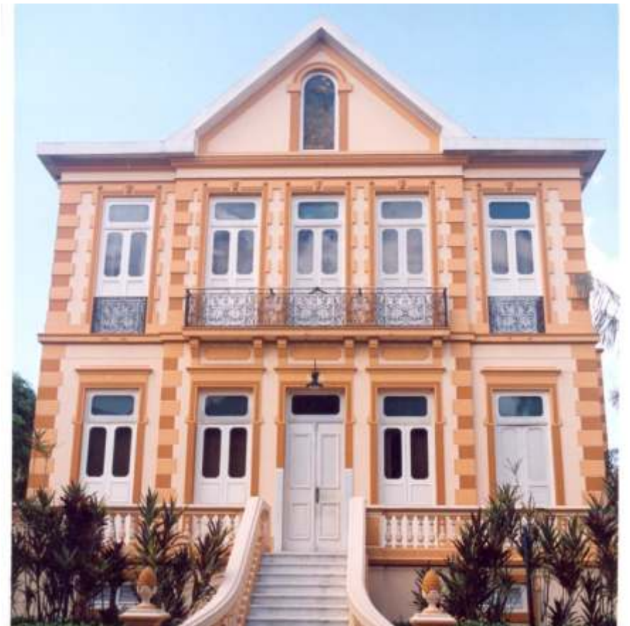
Figura2. Casarão Histórico onde , hoje, funciona o Museu do IEC.

doenças, eventos e agravos. O combate às doenças negligenciadas, socialmente determinadas e o atendimento às populações vulneráveis da Amazônia como os povos das águas, das florestas e do campo, sempre foram uma marca do trabalho incansável do IEC a favor da saúde pública.