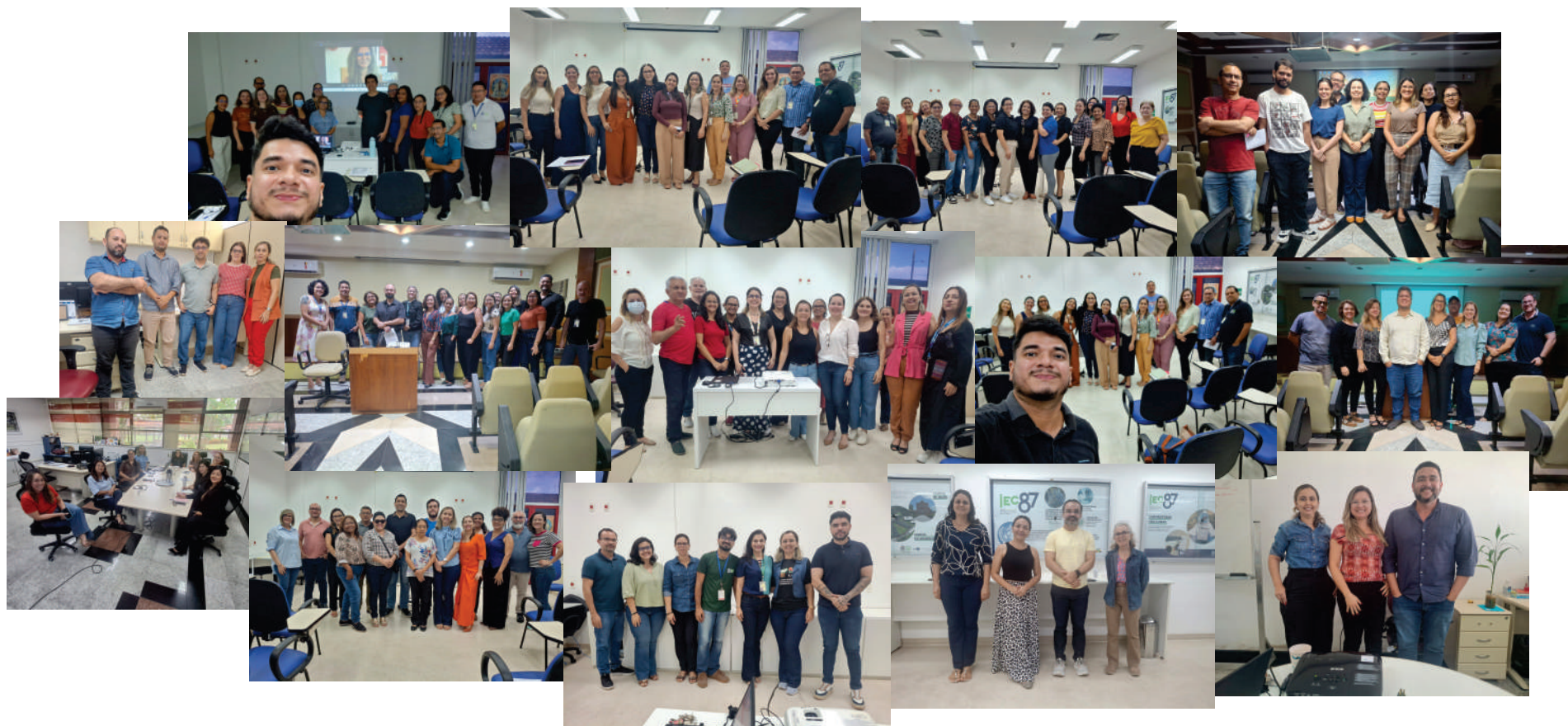
Figura2. Fotos das oficinas de elaboração dos PDU's do IEC em 2025