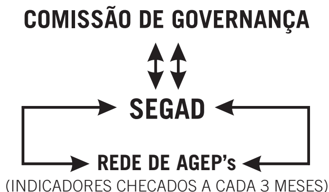
Figura4. Modelo de Gestão dos PDU's

Adicionalmente, os resultados gerais serão sistematizados em um Painel de Acompanhamento , disponível no site institucional do IEC, ampliando a transparência, permitindo o acompanhamento global dos PDUs e fortalecendo a governança e a cultura de resultados da instituição.