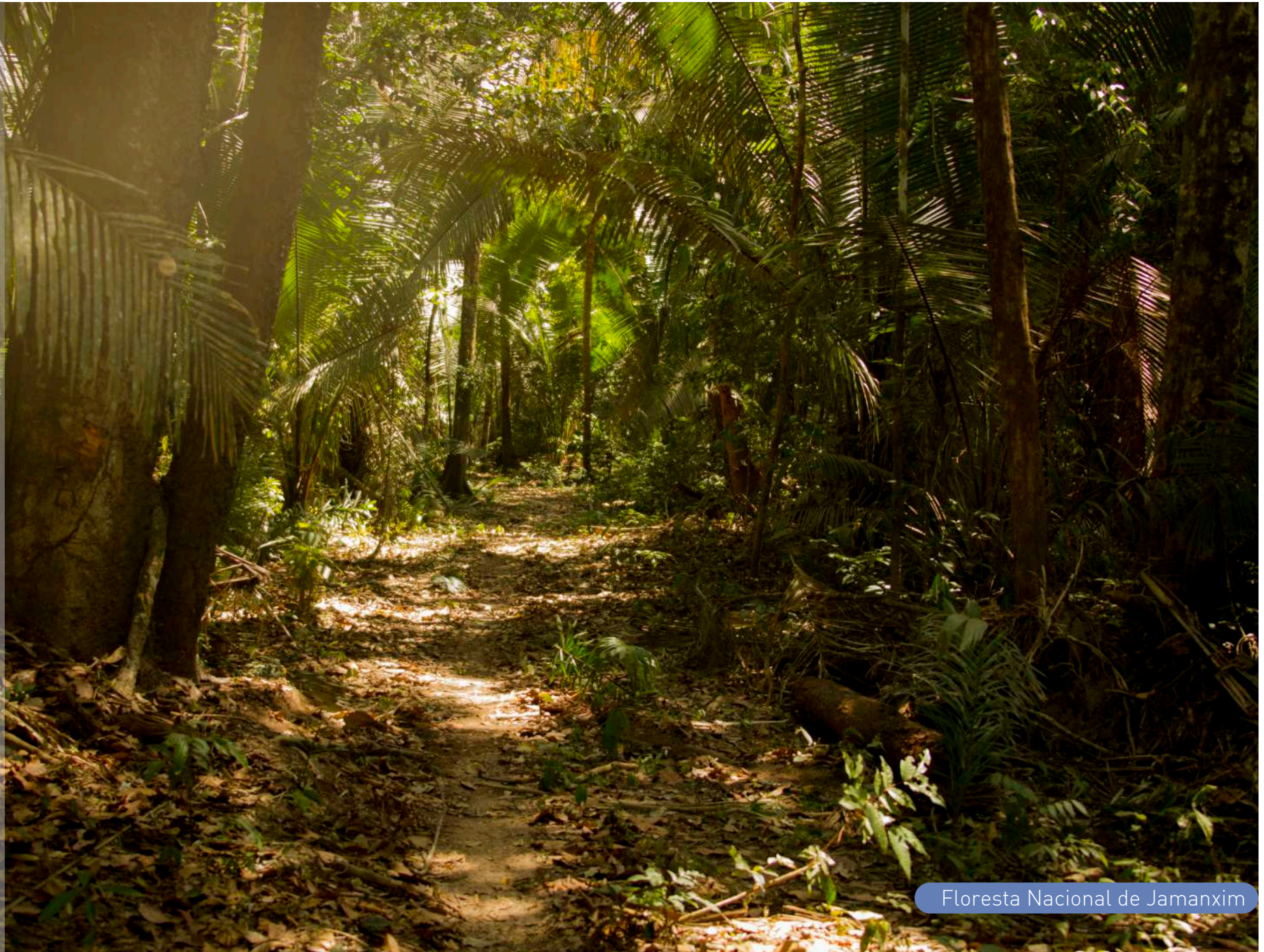
Floresta Nacional de Jamanxim