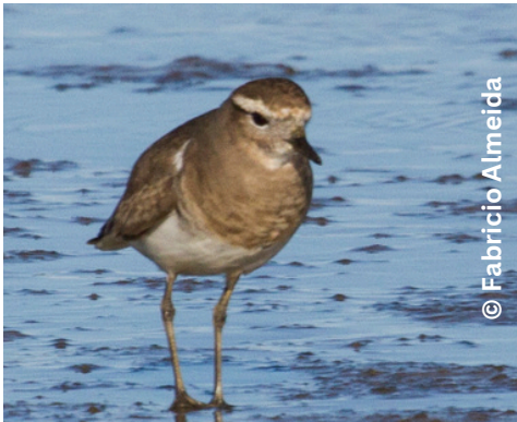
batuíra-de-peito-tijolo Charadrius modestus M