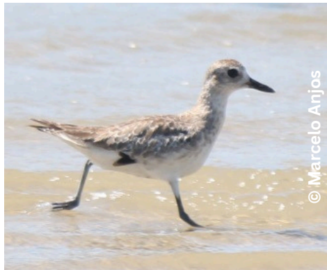
batuiruçu-de-axila-preta Pluvialis squatarola M