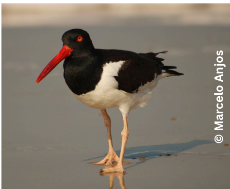
piru-piru Haematopus palliatus G