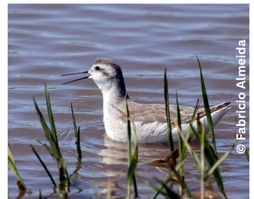
pisa-n'água Phalaropus tricolor M