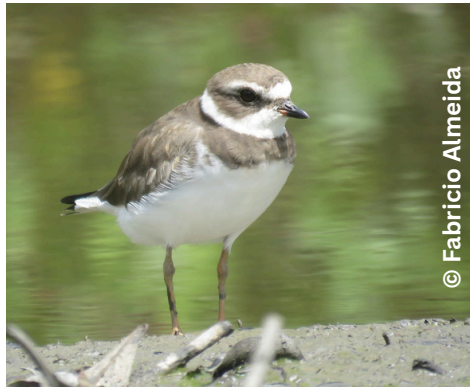
batuíra-de-bando Charadrius semipalmatus P