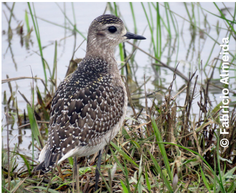
batuiruçu Pluvialis dominica M