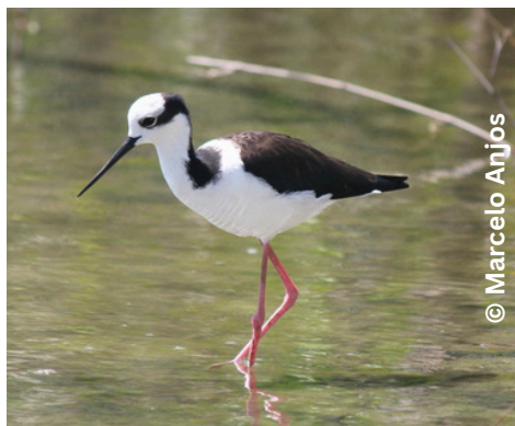
pernilongo-de-costas-brancas Himantopus melanurus G