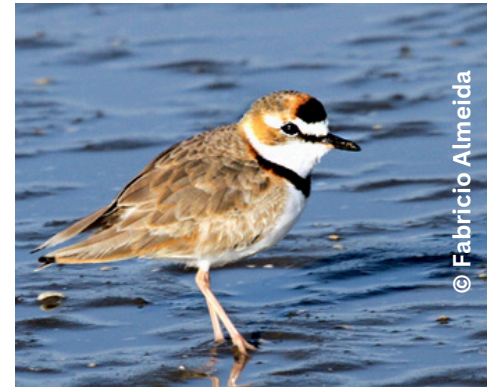
batuíra-de-coleira Charadrius collaris P