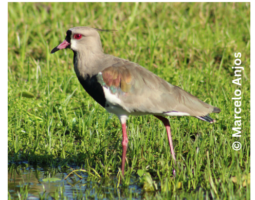
quero-quero Vanellus chilensis G