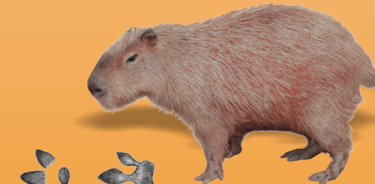
Capivara Hydrochoerus hydrochaeris