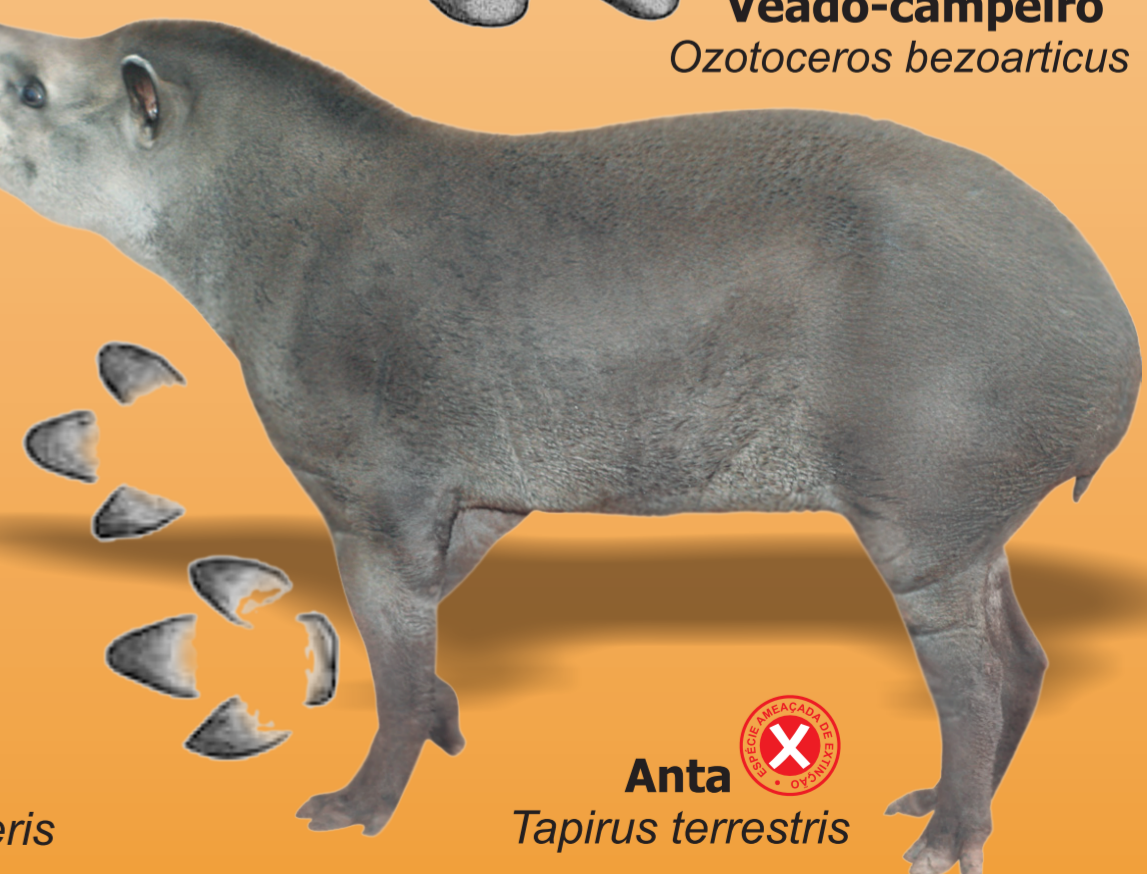
Anta Tapirus terrestris