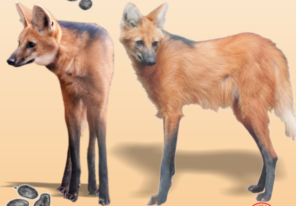
Lobo-guará Chrysocyon brachyurus