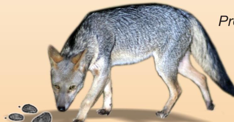
Cachorro-do-mato Cercyon thous