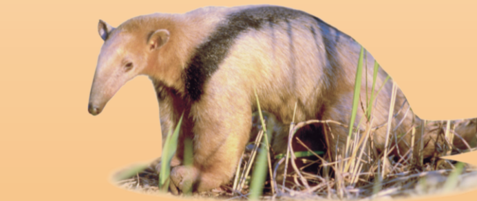
Tamanduá-mirim Tamandua tetradactyla