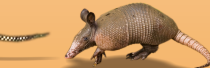
Tatu-galinha Dasypus novemcinctus