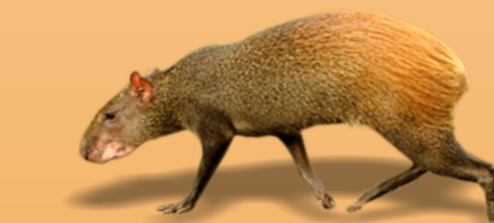
Cutia Dasyprocta azarae