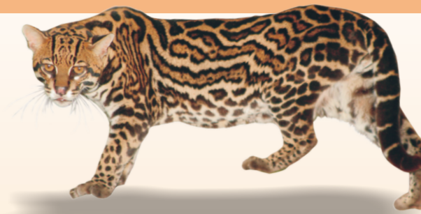
Jaguatirica Leopardus pardalis