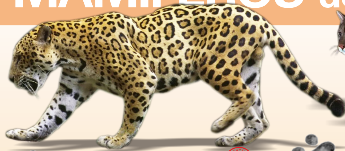
Onça-pintada Panthera onca