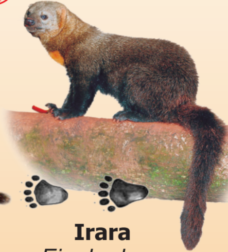
Irara Eira barbara