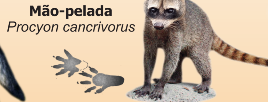
Mão-pelada Procyon cancrivorus