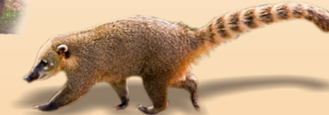
Quati Nasua nasua