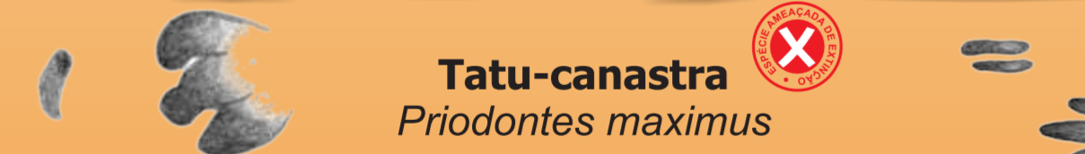
Tatu-canastra Priodontes maximus