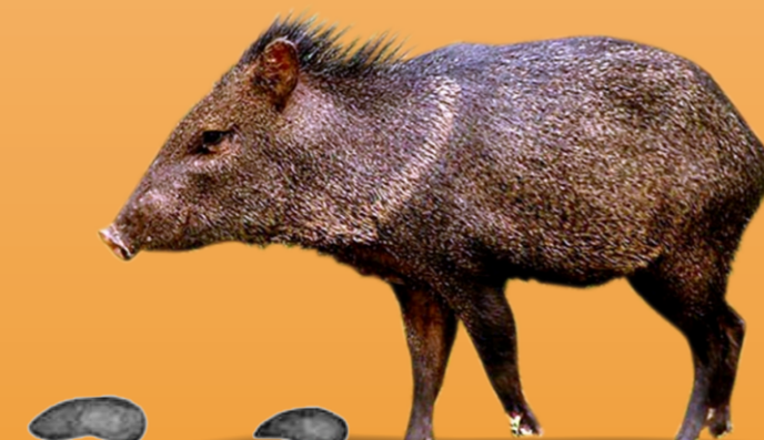
Caititu Pecari tajacu