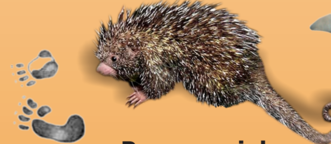
Porco-espinho Coendou prehensilis