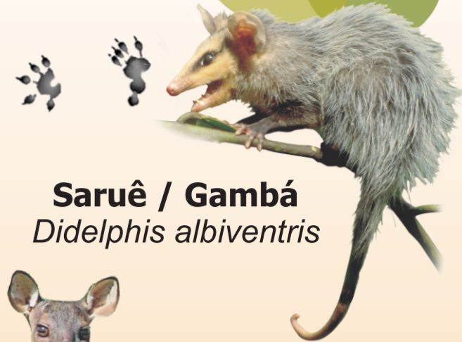
Saruê / Gambá Didelphis albiventris