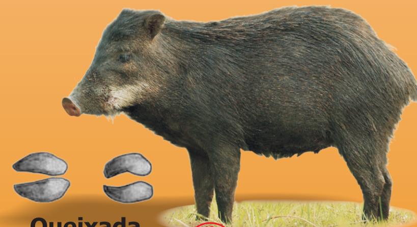
Queixada Tayassu pecari