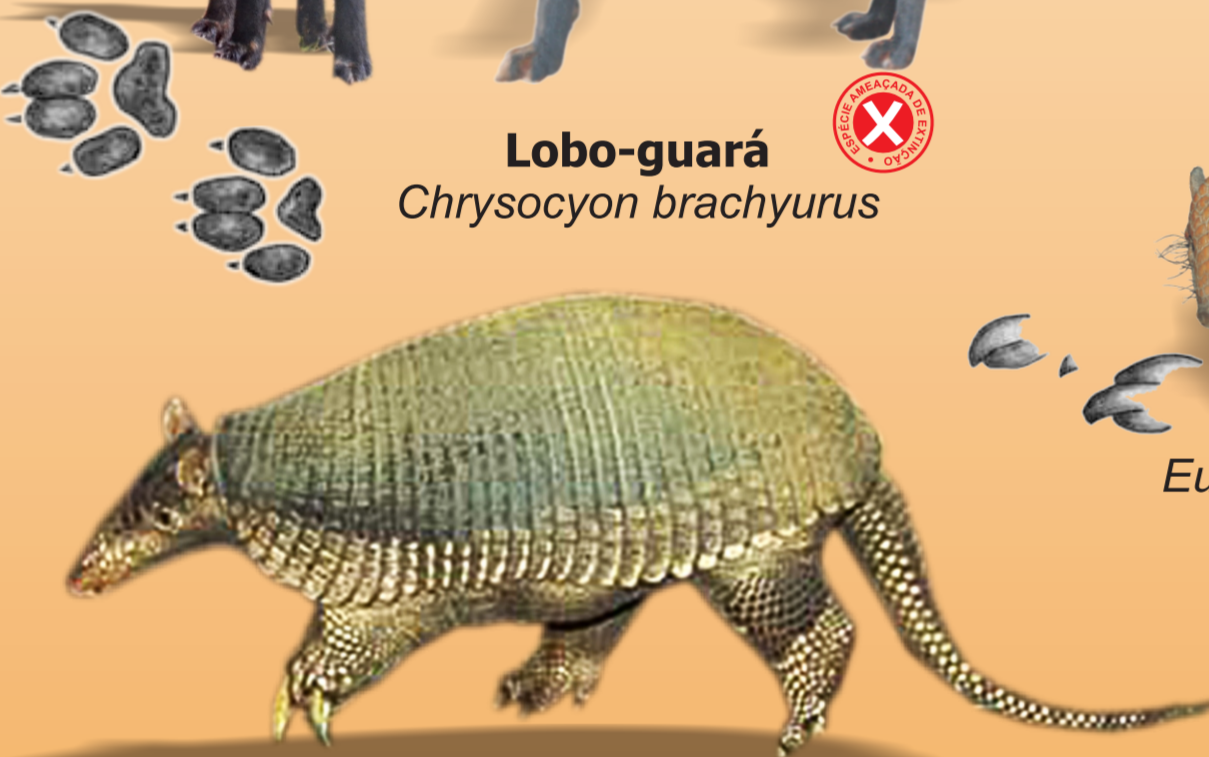
Tatu-peba Euphractus sexcinctus