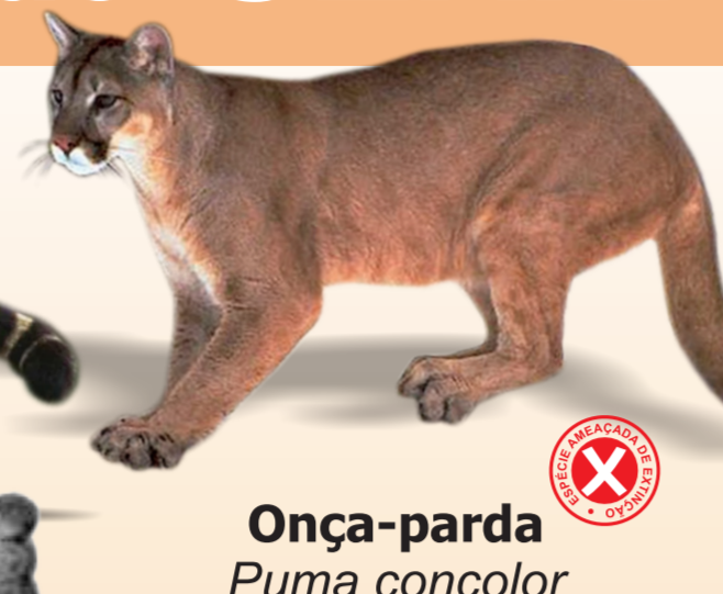
Onça-parda Puma concolor