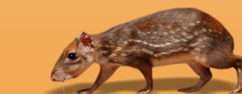
Paca Cunicullus paca