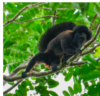
Autor: Tatiane dos Santos Cardoso