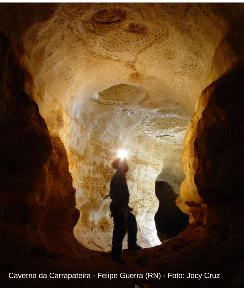
Caverna da Carrapateira - Felipe Guerra (RN)

Para 2023, além dos projetos contínuos desenvolvidos pelo ICMBio/Cecav e outras ações em execução no âmbito dos Termos de Compromisso de Compensação Espeleológica, o centro de pesquisa pretende continuar contando com todos os parceiros, estimulando a pesquisa e promovendo ações de conservação do patrimônio espeleológico brasileiro.