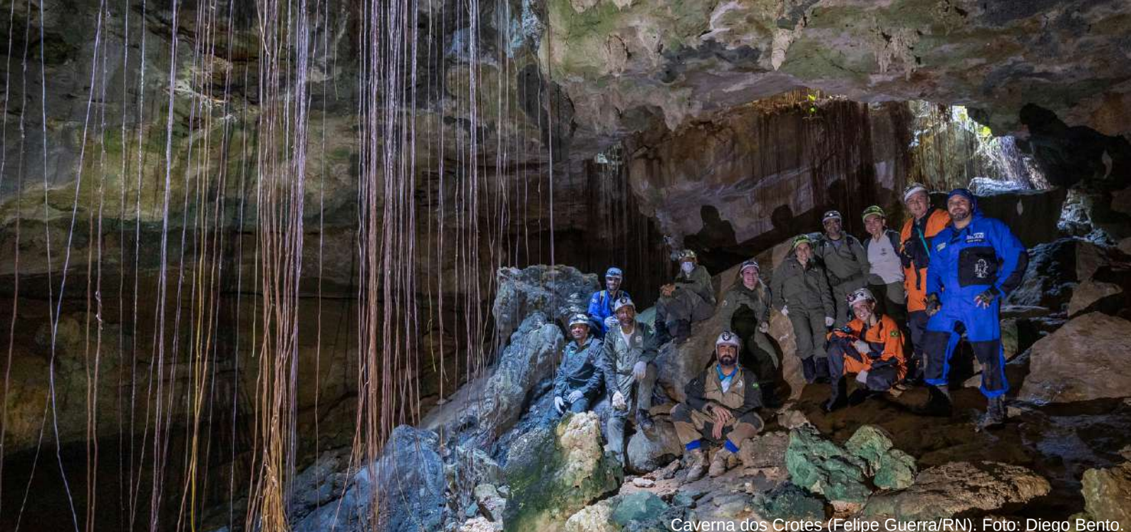
Caverna dos Crotés (Felipe Guerra/RN).

Outra ação recente desenvolvida pelo ICMBio/Cecav é o Caderno de Campo Digital, um aplicativo de caracterização de cavernas que possui um banco de dados interno e que pode ser usado mesmo sem acesso à internet. A ferramenta, disponível na versão android, busca facilitar e padronizar os levantamentos de dados em campo na espeleologia brasileira.