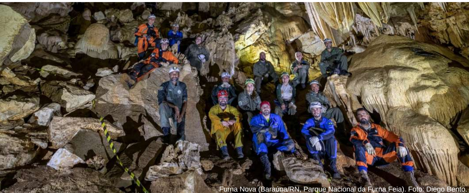
Furna Nova (Baraúna/RN, Parque Nacional da Furna Feia).