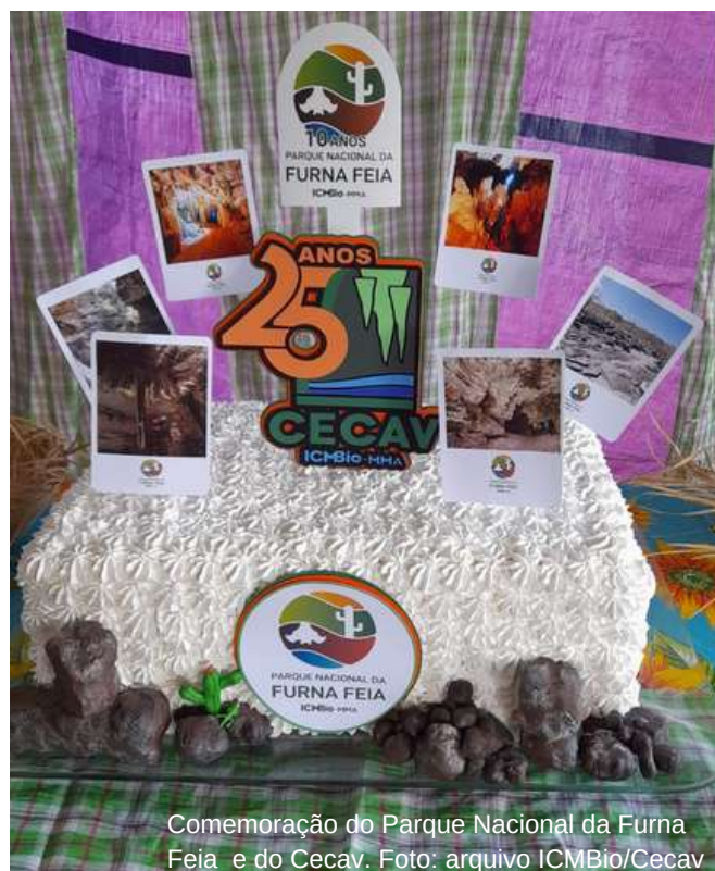
Comemoração do Parque Nacional da Furna Feia e do Cecav.

Entre as ações que marcaram este ano está o I Prêmio Nacional de Espeleologia Michel Le Bret, realizado em parceria com a Sociedade Brasileira de Espeleologia (SBE). A premiação ocorreu em abril deste ano, no 36º Congresso Brasileiro de Espeleologia (CBE).