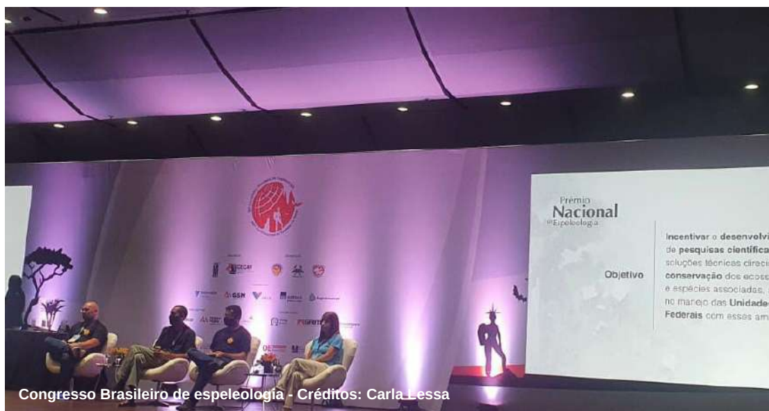
Congresso Brasileiro de espeleologia