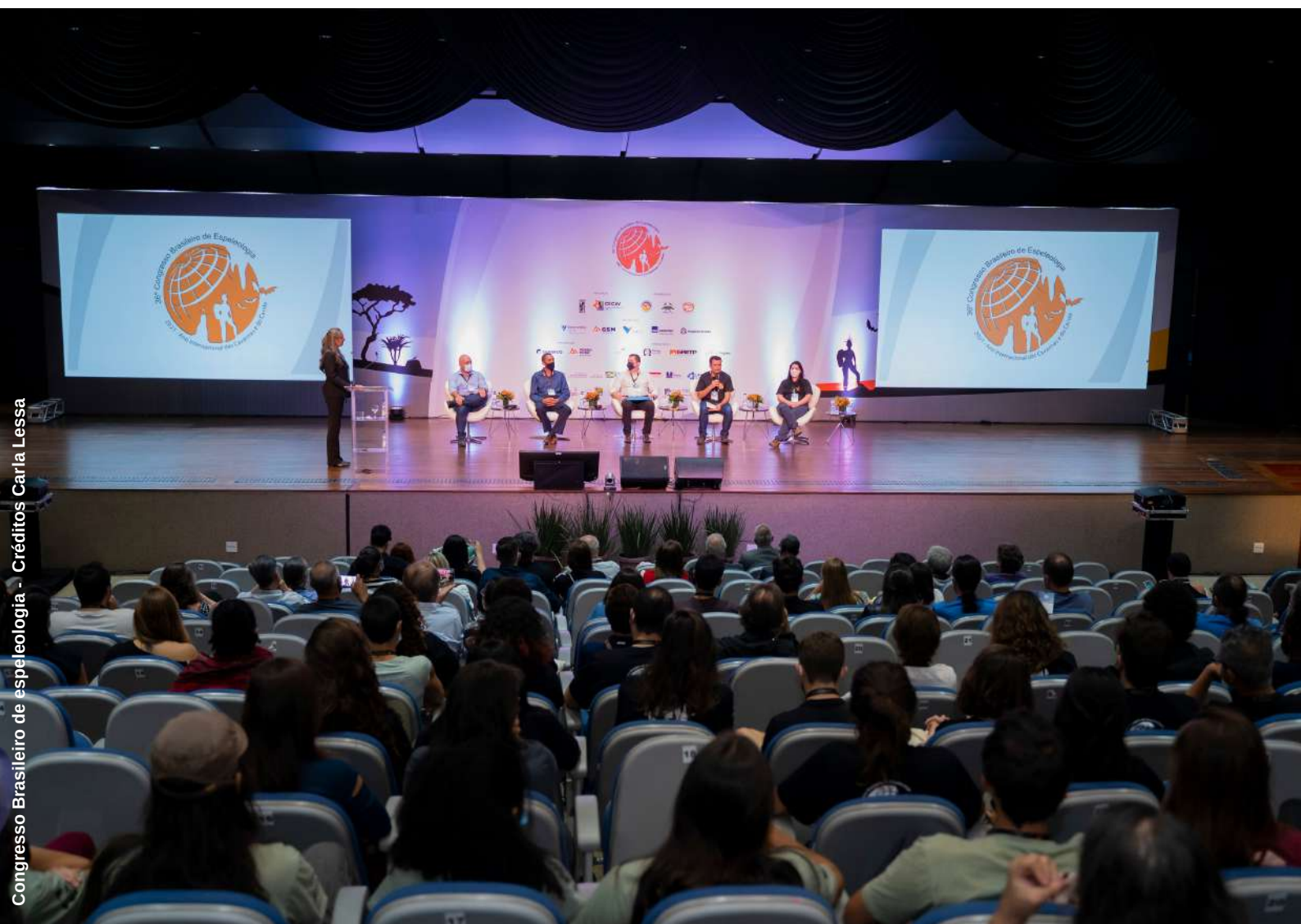
Congresso Brasileiro de espeleologia