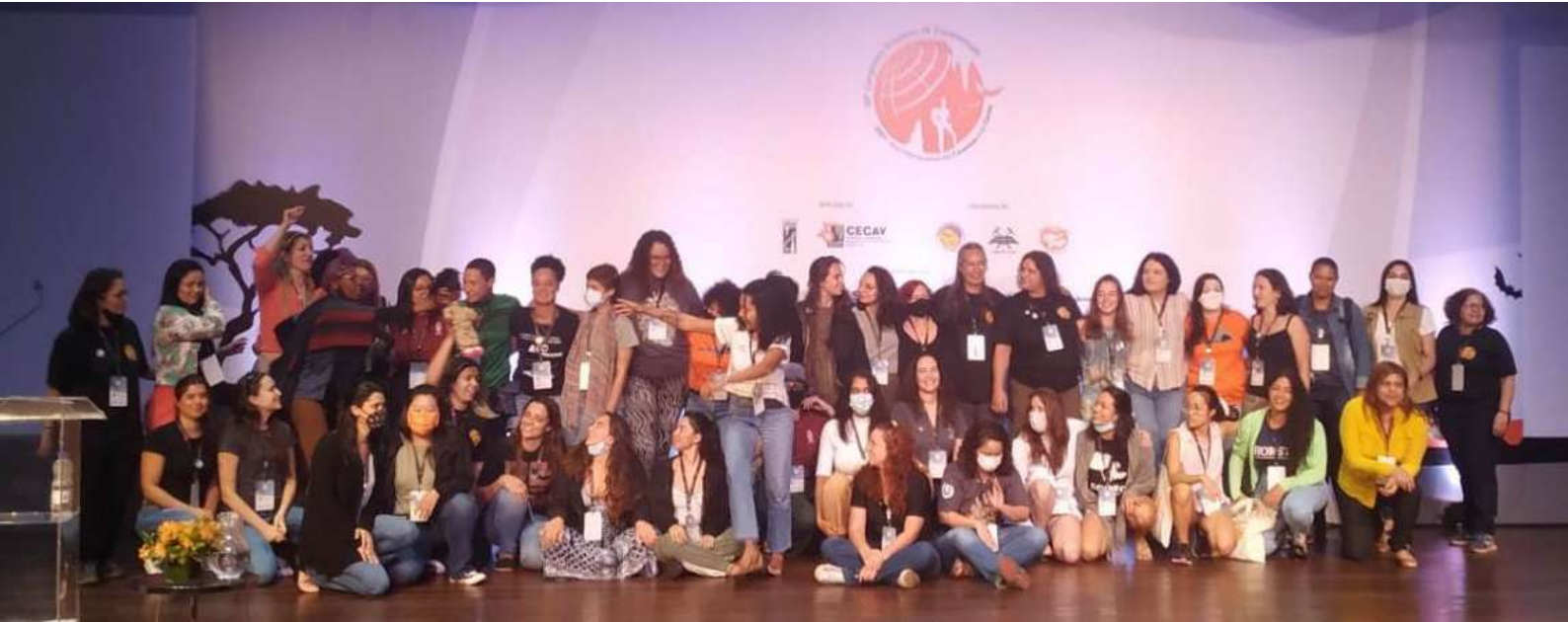
Palestra "Mulheres na Espeleologia Brasileira: dos desafios históricos e panorama atual às perspectivas futuras".