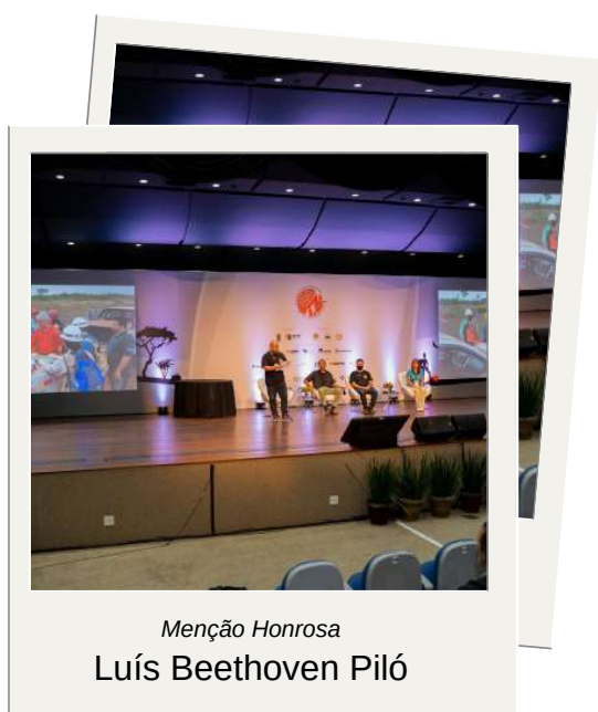
Menção Honrosa Luís Beethoven Piló