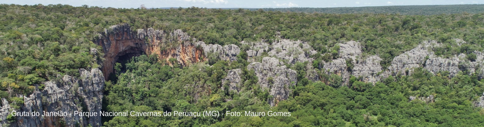
Gruta do Janelão - Parque Nacional Cavernas do Peruaçu (MG)