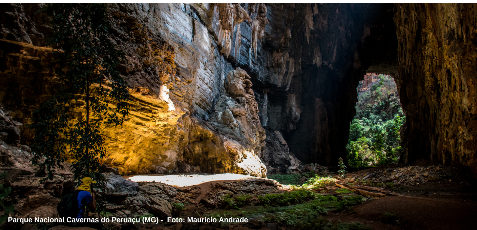
Parque Nacional Cavernas do Peruaçu (MG) - Foto: Maurício Andrade

O encontro está sendo organizado pelos membros do Espeleonordeste, da Sociedade Excursionista e Espeleológica, Guano Speleo e do Espeleogrupo Peter Lund, que também contam com a contribuição do Espeleo Planalto Central.