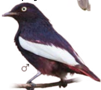
bacacu-de-asa-branca Xipholena atropurpurea