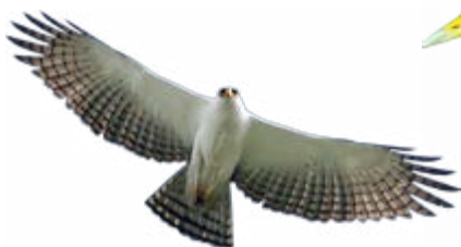
gavião-pato Spizaetus melanoleucus