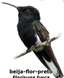
beija-flor-preto Florisuga fusca