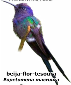
beija-flor-tesoura Eupetomena macroura