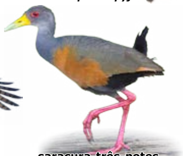
saracura-três-potes Aramides cajaneus