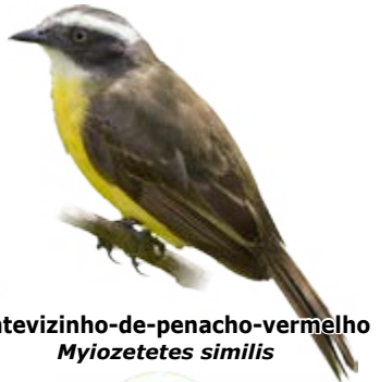
bentevizinho-de-penacho-vermelho Myiozetetes similis