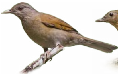
sabiá-branco Turdus leucomelas