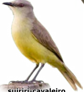
suiriri-cavaleiro Machetornis rixosa