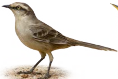
sabiá-do-campo Mimus saturninus