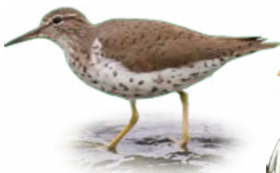
maçarico-pintado Actitis macularius