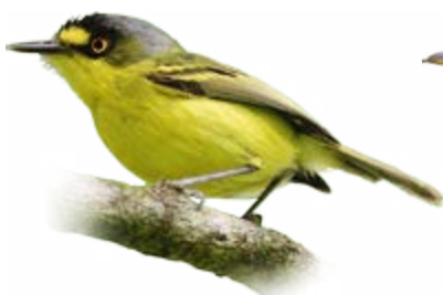
teque-teque Todirostrum poliocephalum