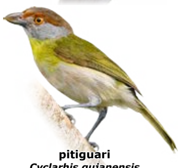
pitiguari Cyclarhis gujanensis