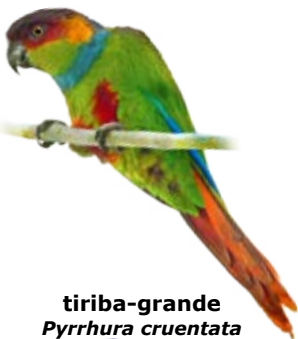
tiriba-grande Pyrhura cruentata