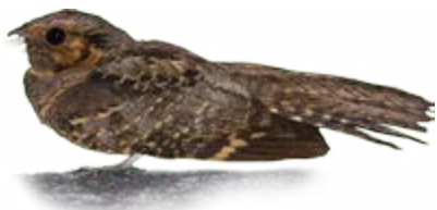
bacurau Nyctidromus albicollis