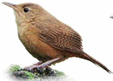
corruíra Troglodytes musculus