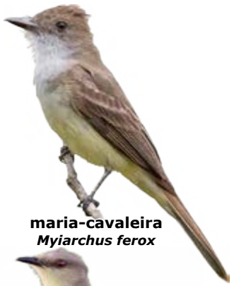
maria-cavaleira Myiarchus ferox