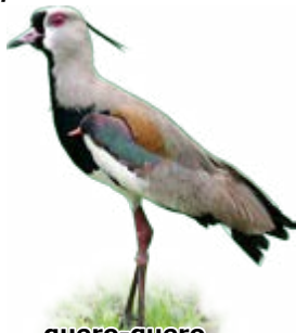
quero-quero Vanellus chilensis