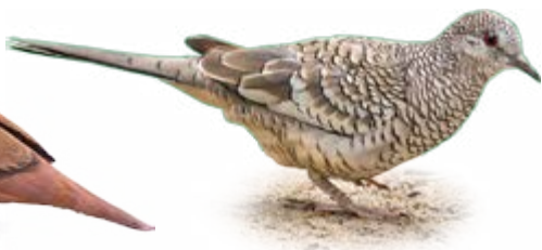
fogo-apagou Columbina squammata