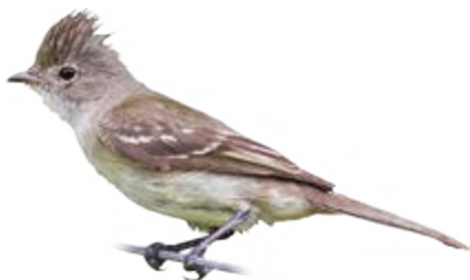
guaracava-de-barriga-amarela Elaenia flavogaster