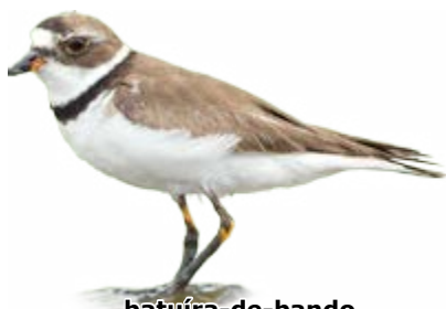
batuíra-de-bando Charadrius semipalmatus