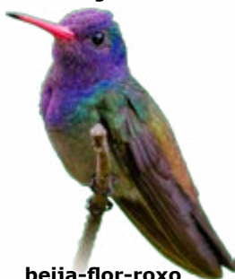
beija-flor-roxo Hylocharis cyanus