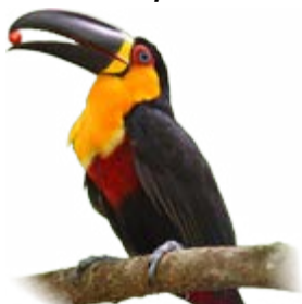
tucano-de-bico-preto Ramphastos vitellinus