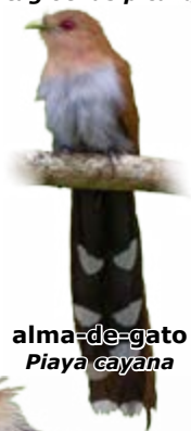
alma-de-gato Piaya cayana