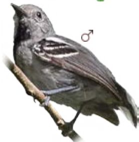
choquinha-de-rabo-cintado Myrmotherula urosticta