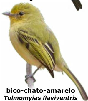
bico-chato-amarelo Tolmomyias flaviventris