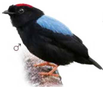
tangará-príncipe Chiroxiphia pareola