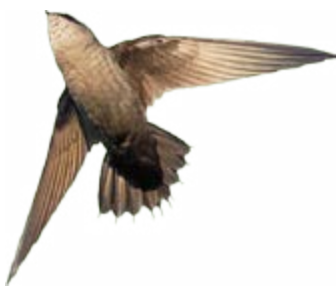
andorinhão-de-sobre-cinzento Chaetura cinereiventris