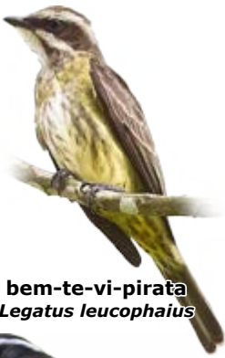
bem-te-vi-pirata Legatus leucophaeus