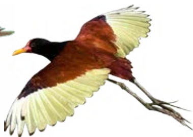
jaçanã Jacana jacana