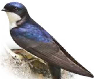
andorinha-pequena-de-casa Pygochelidon cyanoleuca