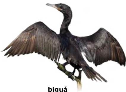
biguá Nannopterum brasilianus