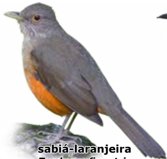
sabiá-laranjeira Turdus rufiventris