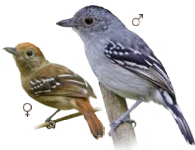
choca-de-sooretama Thamnophilus ambiguus