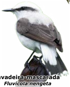
lavadeira-mascarada Fluvicola nengeta