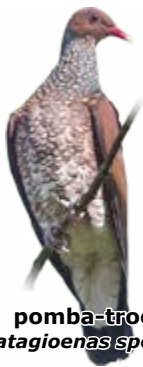
pomba-trocal Patagioenas speciosa