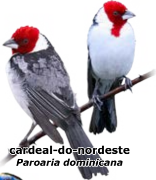
cardeal-do-nordeste Paroaria dominicana