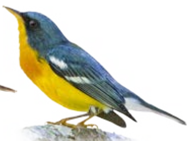
mariquita Setophaga pitiayumi