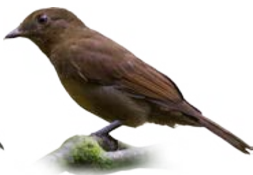
flautim-marrom Schiffornis turdina