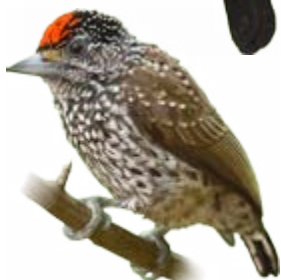
picapauzinho-escamoso Picumnus albosquamatus