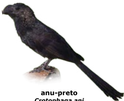
anu-preto Crotophaga ani