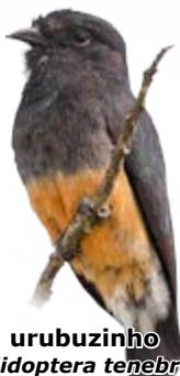
urubuzinho Chelidoptera tenebrosa