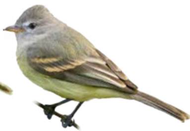
risadinha Camptostoma obsoletum