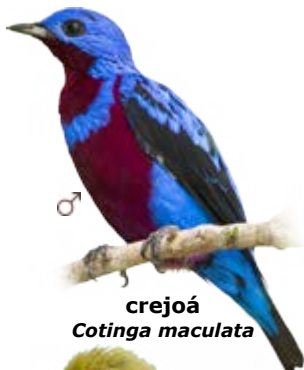
crejoá Cotinga maculata