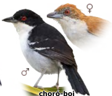
choró-boi Taraba major