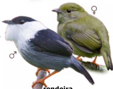
rendeira Manacus manacus