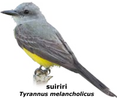
suiriri Tyrannus melancholicus