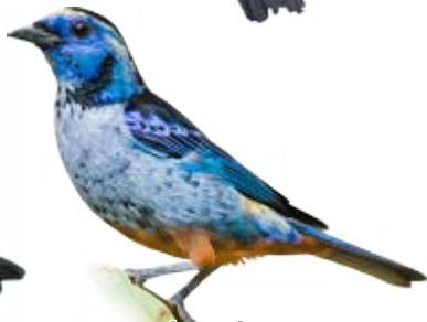
saira-pérola Tangara cyanomelas