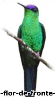
beija-flor-de-fronte-violeta Thalurania glaucopis