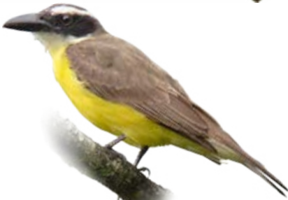
neinei Megarynchus pitangua