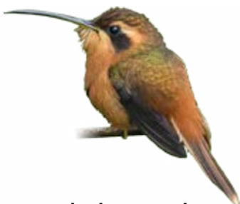
rabo-branco-rubro Phaethornis ruber