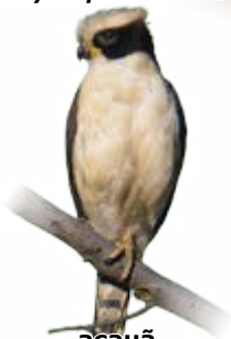
acauiã Herpetotheres cachinnans