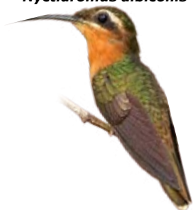
balança-rabo-canela Glaucis dohrnii