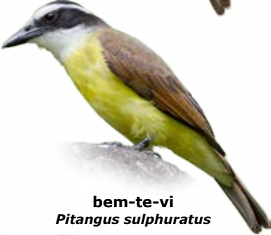
bem-te-vi Pitangus sulphuratus