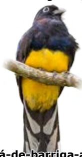
surucúa-de-barriga-amarela Trogon viridis