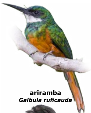
ariramba Galbula ruficauda