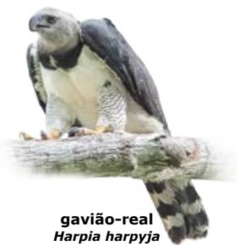
gavião-real Harpia harpyja