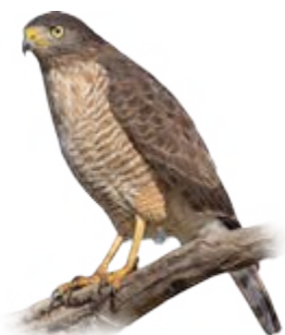
gavião-carijó Rupornis magnirostris