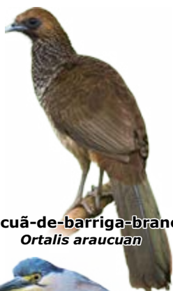
aracuã-de-barriga-branca Ortalis araucuan