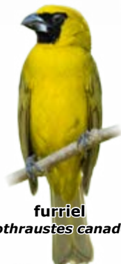
furriel Caryothraustes canadensis