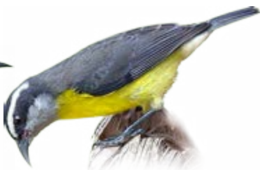
cambacica Coereba flaveola