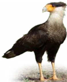
carcará Caracara plancus