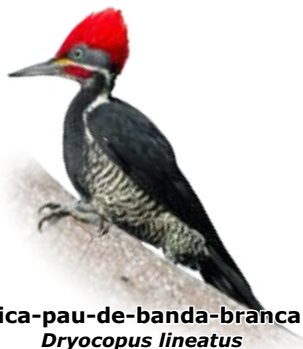
pica-pau-de-banda-branca Dryocopus lineatus