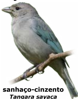
sanhaço-cinzentó Tangara sayaca