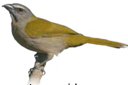
tempera-viola Saltator maximus