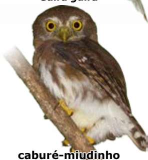
caburé-miudinho Glaucidium minutissimum