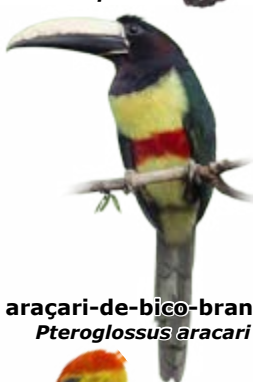
araçari-de-bico-branco Pteroglossus aracari