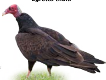
urubu-de-cabeça-vermelha Cathartes aura