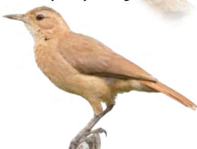
João-de-barro Furnarius rufus