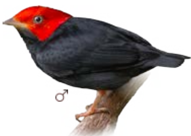
cabeça-encarnada Ceratopira rubrocapilla