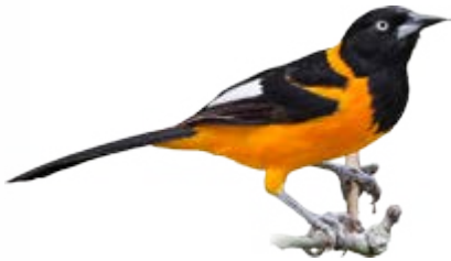
corrupião Icterus jamacaii