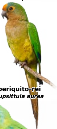
periquito-rei Eupsittula aurea