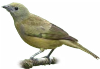
sanhaço-do-coqueiro Tangara palmarum