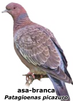
asa-branca Patagioenas picazuro