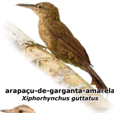
arapaçu-de-garganta-amarela Xiphorhynchus guttatus