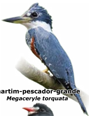
martim-pescador-grande Megaceryle torquata