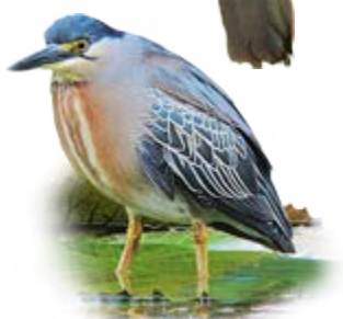
socozinho Butorides striata