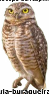
coruja-buraqueira Athene cunicularia