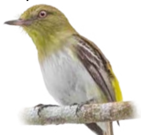
capitão-de-saíra-amarelo Attila spadiceus