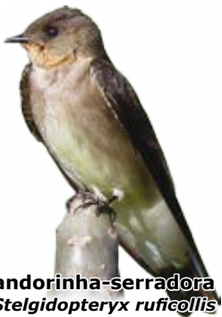
andorinha-serradora Stelgidopteryx ruficollis