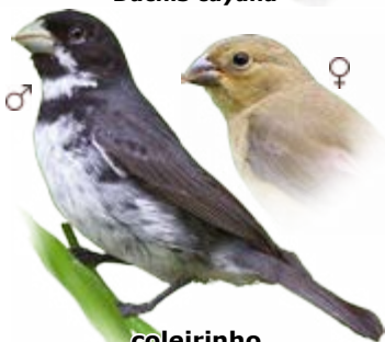
coleirinho Sporophila caerulescens