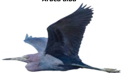
garça-azul Egretta caerulea