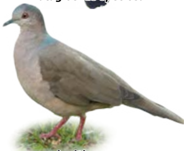
juriti-pupu Leptotila verreauxi