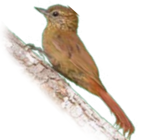
arapaçu-bico-de-cunha Glyphorhynchus spirurus