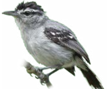
chorozinho-de-boné Herpsilochmus pileatus