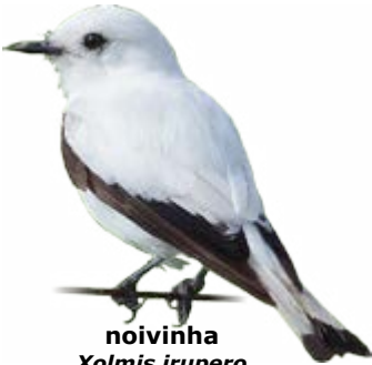
noivinha Xolmis irupero