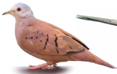
rolinha Columbina talpacoti