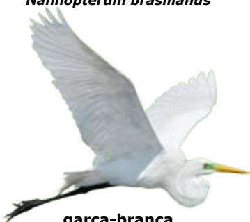
garça-branca Ardea alba