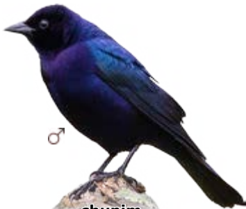
chupim Molothrus bonariensis