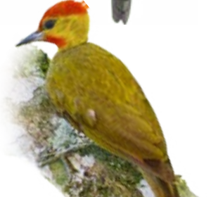
pica-pau-bufador Piculus flavigula