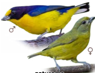
gaturamo Euphonia violacea