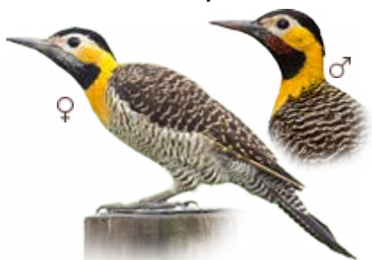
pica-pau-do-campo Colaptes campestris