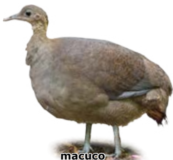
macuco Tinamus solitarius