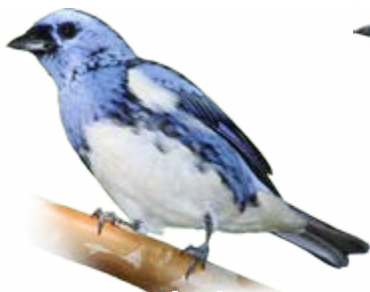
cambada-de-chaves Tangara brasiliensis