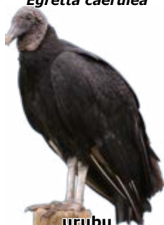
urubu Coragyps atratus