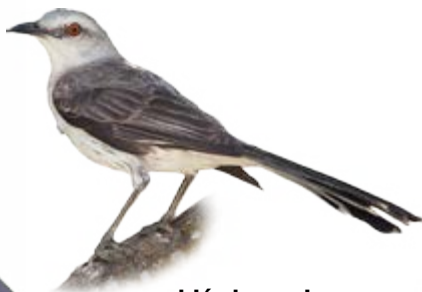
sabiá-da-praia Mimus gilvus