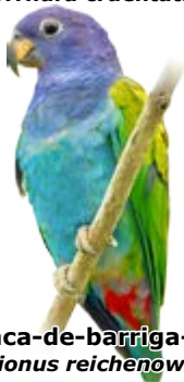
maitaca-de-barriga-azul Pionus reichenowi