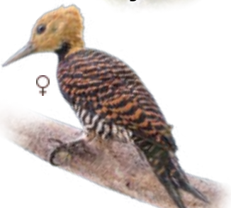
pica-pau-de-coleira Celeus torquatus