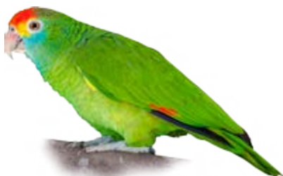
chauá Amazona rhodocorytha