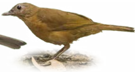
sabiá-da-mata Turdus fumigatus