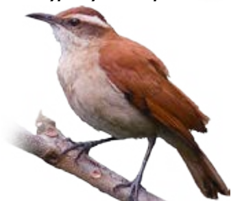
casaca-de-couro-da-lama Furnarius figulus