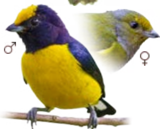
fim-fim-grande Euphonia xanthogaster