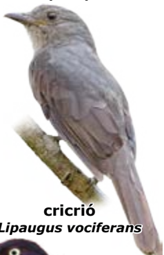
cricrió Lipaugus vociferans