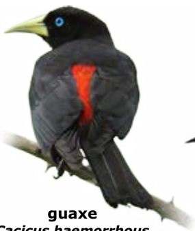
guaxe Cacicus haemorrhous