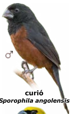
curió Sporophila angolensis