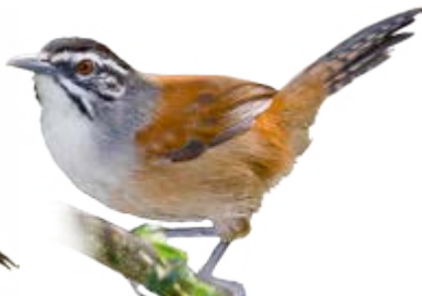
garrinção-pai-avô Pheugopedius genibarbis