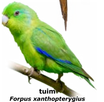
tuim Forpus xanthopterygius