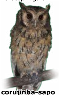
corujinha-sapo Megascops atricapilla