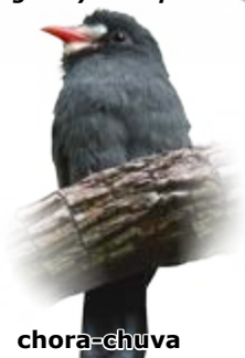
chora-chuva Monasa morphoeus