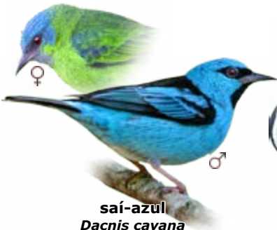
saí-azul Dacnis cayana