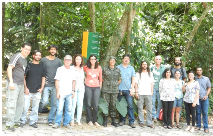
Fig.01: Alguns dos participantes da Oficina de Avaliação de Meio Termo do PAN Sauim-de-coleira, realizada em setembro de 2013 no Paiol da Cultura/INPA, Manaus-AM (Foto: Banco de Imagens do CPB).

http://www.icmbio.gov.br/portal/images/stories/comunicacao/downloads/ICMBio_em_Foco_264.pdf