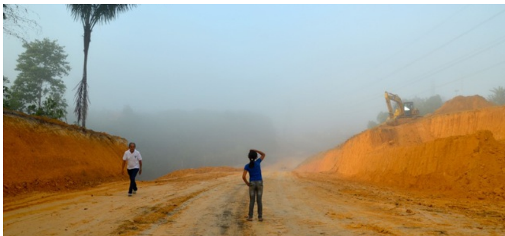
Figura 3: Máquinas trabalham para a construção da Av. das Flores, expansão da Av. das Torres, na zona norte de Manaus.

estado. Dentro do Termo de Ajuste de Conduta (TAC) ficou acertado que o estado, em conjunto com o município, custeará passagens de fauna (passarelas), redutores de velocidade, placas sinalizadoras, recuperação de áreas degradadas, um projeto de Educação Ambiental (Semana do Sauim-de-coleira) e um filme curta metragem. As negociações estão nos trâmites finais e, segundo Marcelo Raseira (CEPAM/ICMBio), já foram encaminhadas as justificativas e os locais para a instalação das placas e redutores de velocidade para a Manaustrans e para a Seinfra, e enviadas a proposta da Semana do Sauim-de-coleira e do vídeo.