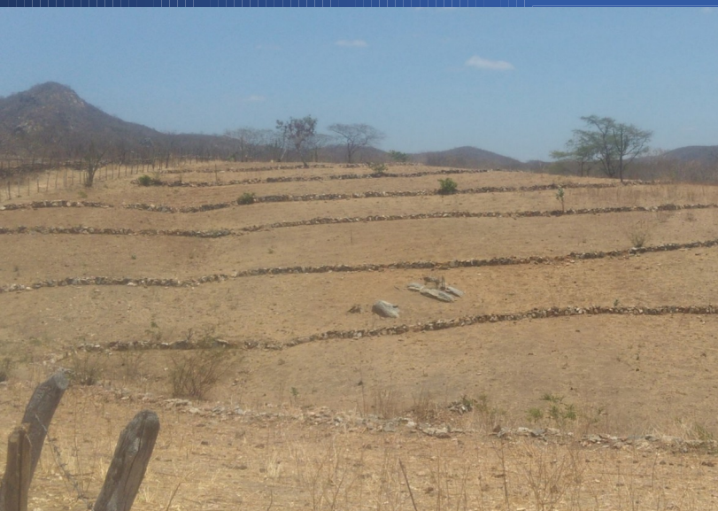
Cordões de pedra