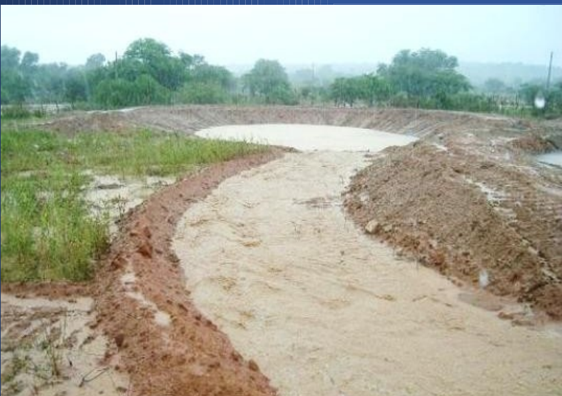
Barraginhas e terraceamentos