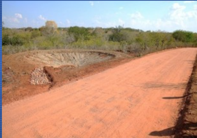
Recuperação de estradas