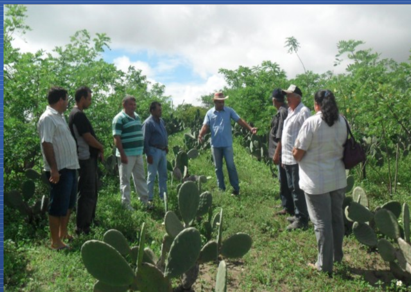
Integração lavoura, pecuária e floresta