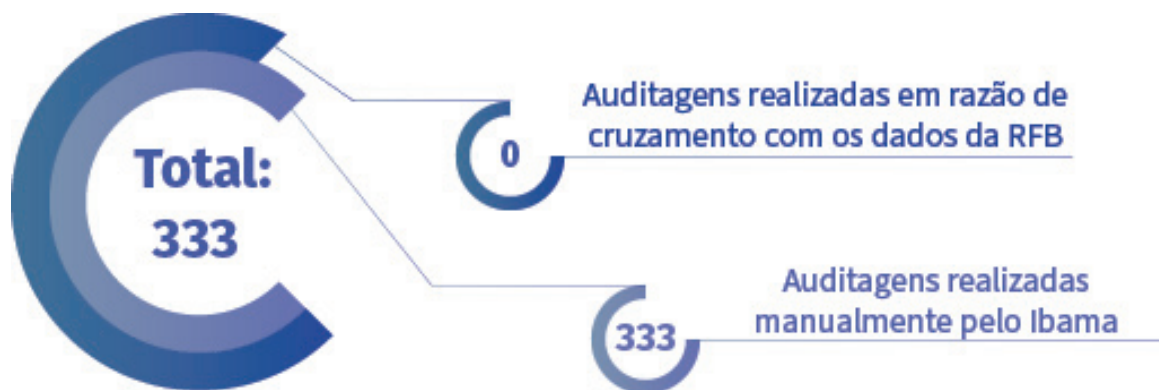
Figura 1. Total de auditorias realizadas no 1º trimestre de 2022.

No 1º trimestre de 2022, foram realizadas 333 auditorias (Figura 1) realizadas exclusivamente pelos servidores do Ibama, em processos de trabalho rotineiros de verificação de consistência de dados de inscrições.