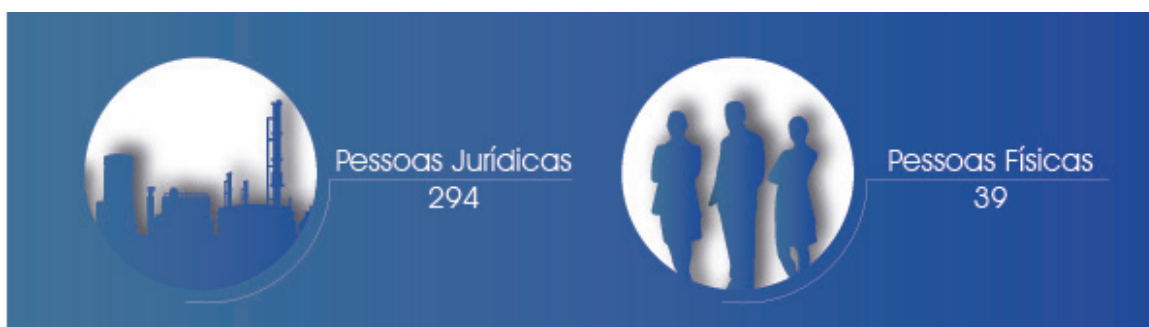
Figura 2. Total de auditorias por tipo de pessoa no 1º trimestre de 2022.

Foram efetuadas 294 (88,3%) auditorias de pessoas jurídicas e 39 (11,7%) auditorias de pessoas físicas (Figura 2).