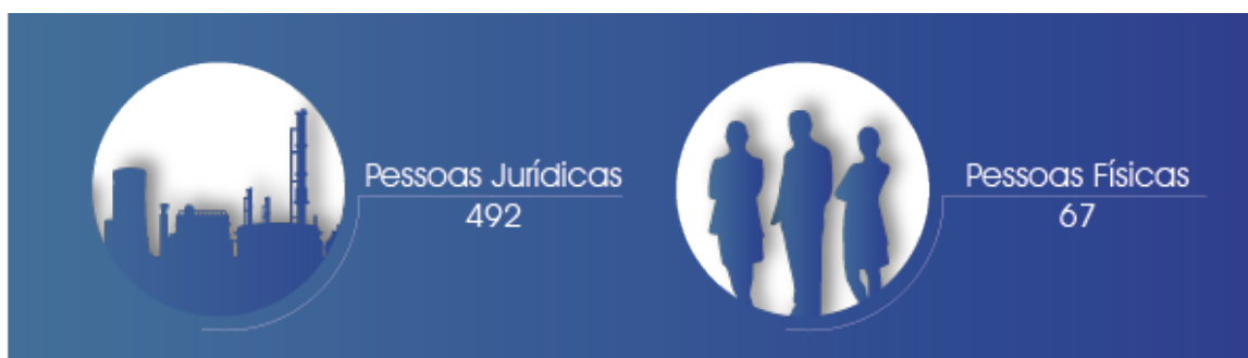
Figura 2. Total de auditagens por tipo de pessoa no 3º trimestre de 2021.

Foram efetuadas 492 (91,4%) auditagens de pessoas jurídicas e 67 (8,6%) de pessoas físicas (Figura 2).