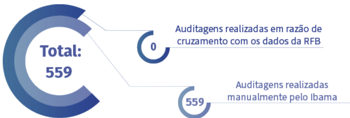
Figura 1. Total de auditorias realizadas no 3º trimestre de 2021.

No 3º trimestre de 2021, foram realizadas 559 auditorias (Figura 1) realizadas exclusivamente por servidores do Ibama, em processos de trabalho rotineiro de verificação de consistência de dados de inscrições.