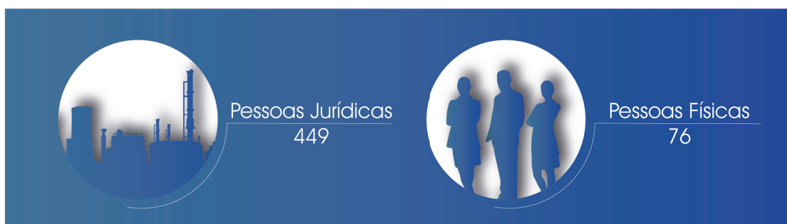
Figura 2. Total de auditagens por tipo de pessoa no 3º trimestre de 2020.

Foram efetuadas 449 (85,5%) auditagens de pessoas jurídicas e 76 (14,5%) auditagens de pessoas físicas (Figura 2).