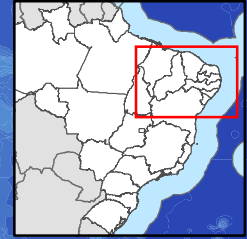
Localização da área no contexto regional

Elaboração: Núcleo de Monitoramento e Informações Ambientais - NMI/IBAMA/RN Data da Elaboração: 14/10/2019 Sistema de Coordenadas Geográficas Datum Horizontal: SIRGAS 2000