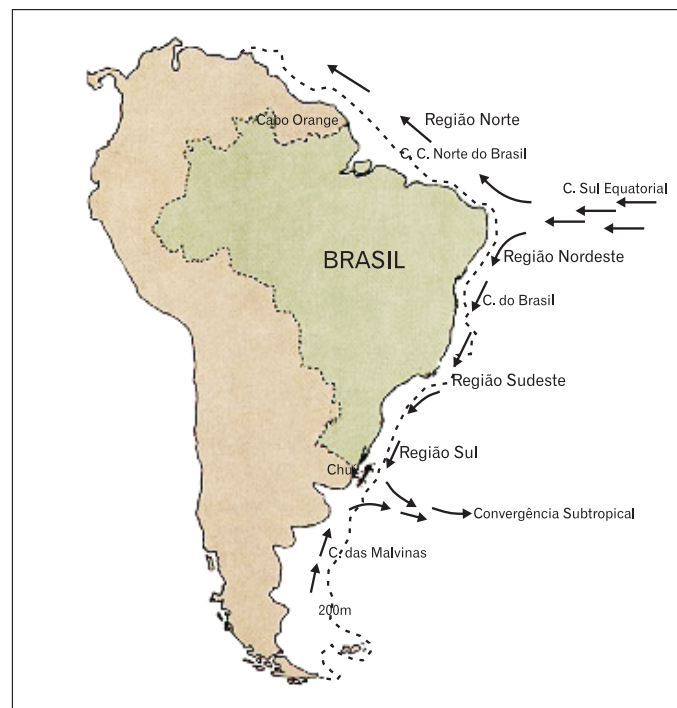
Figura 1 - Correntes marítimas da costa brasileira

Objetivando suprir lacunas de conhecimento sobre o potencial de recursos em toda a Zona Econômica Exclusiva-ZEE, o Programa “Avaliação do Potencial Sustentável de Recursos Vivos na Zona Econômica Exclusiva” - Programa Revizee resultou do detalhamento da meta principal a ser alcançada pelo IV Plano Setorial para os Recursos do Mar (PSRM), que vigorou no período 1994/1998. O V PSRM, com vigência para o período de 1999 a 2003, manteve o Programa como linha de “pesquisa prioritária” em suas estratégias de ação (CIRM, 1999).