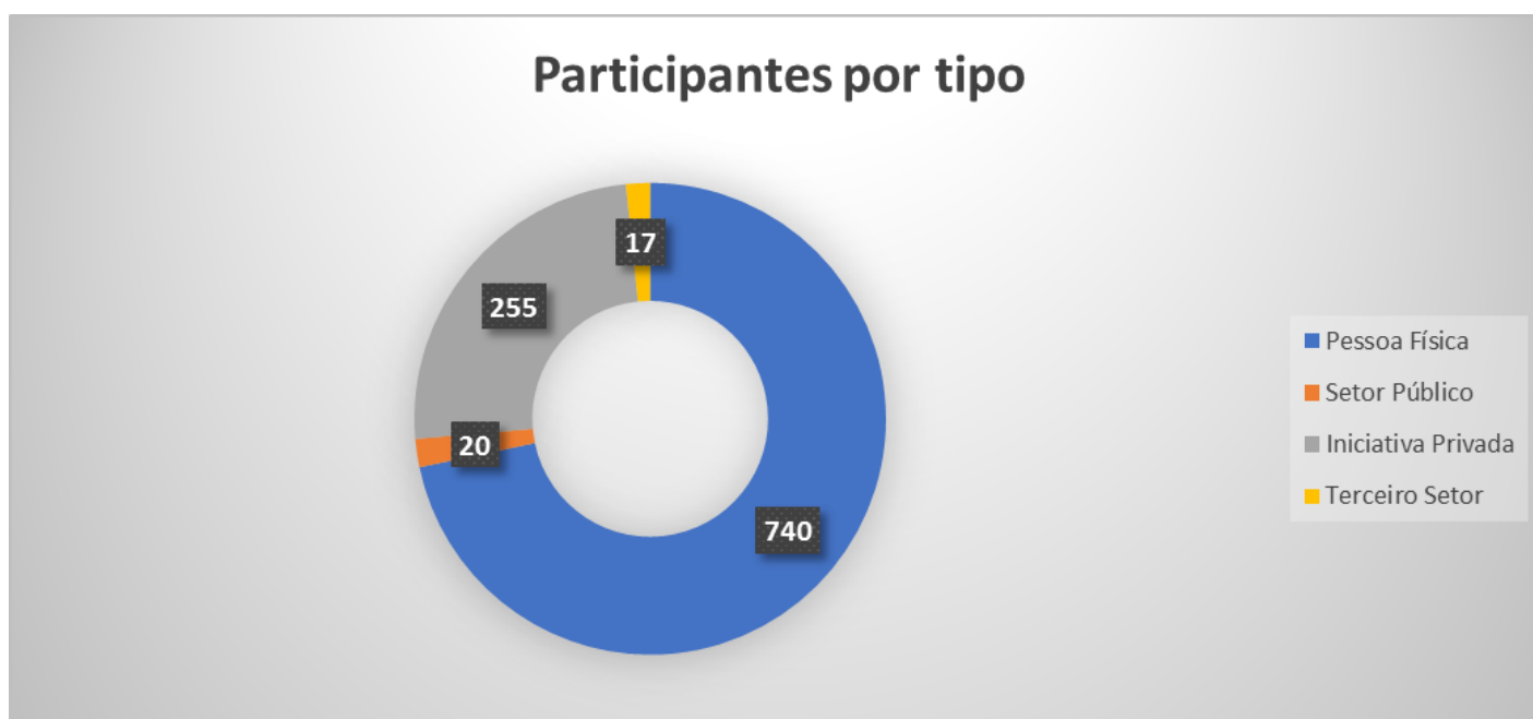
Figura 2. Contagem dos participantes em função do setor da sociedade civil a que pertencem.

4.8. Como pode ser verificado no Sumário do Parecer Técnico 2 (Sei Ibama nº 17009754), colocado em CP, havia quarenta e sete tópicos passíveis de receber comentários, críticas e/ou sugestões e, caso desejasse, cada contribuinte poderia comentar em todos eles. Apesar de orientação prévia deste Instituto acerca da inserção de contribuições em tópicos específicos, constatou-se que a maior parte das contribuições, que abordavam diferentes observações sobre a reavaliação do tiametoxam, foram inseridas no "resumo" ou não especificaram um tópico. Dessa forma, não foi possível uma análise apropriada sobre a distribuição das contribuições recebidas para cada tópico tratado no Parecer.