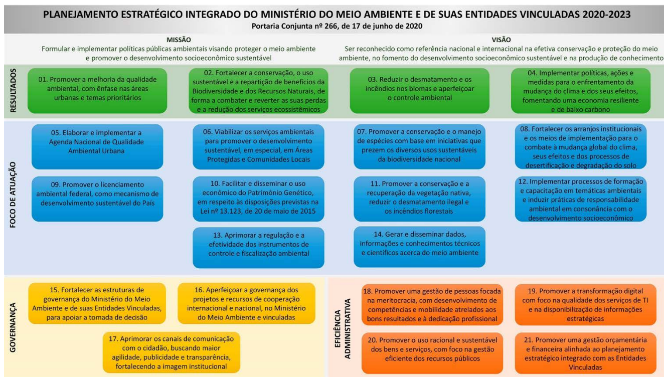
Figura 2 – Mapa estratégico do Ibama (2020-2023)