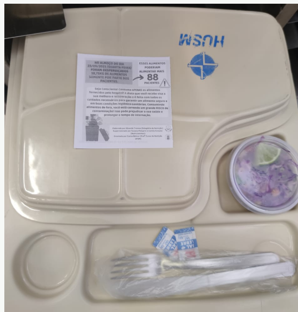
Figura 5 – Material enviado aos pacientes