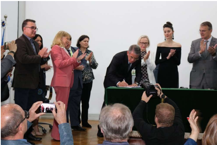
Presidente da Ebserh, Oswaldo de Jesus Ferreira, assinando o termo de contratualização.

Somou-se a esse fato, os valores destinados pela Ebserh, mediante o programa de Reestruturação dos Hospitais Universitários Federais (Rehuf) e pela UFSM. Tais investimentos permitiram ao Husm, no último período, sanear suas contas, não restando dívidas com fornecedores, contratos terceirizados e outros, além de promover importantes melhorias na estrutura física e tecnológica.