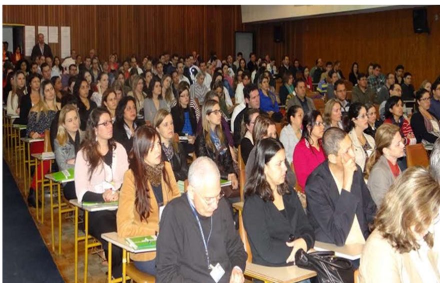
Primeira convocação, em 1º de setembro de 2014, com a contratação de 240 profissionais.

A partir de 2014, foram realizados cinco concursos públicos. A primeira convocação, de maior impacto, ocorreu em 1º de setembro de 2014, com a contratação de 240 profissionais. Seguida de mais 53 convocações para compor o quadro funcional. Os resultados e impactos dessa primeira fase foram publicados pelo Colegiado Executivo: “Ebserh-Gestão Inovadora no HUSM”, no livro Experiências Empreendedoras , lançado em 2019.