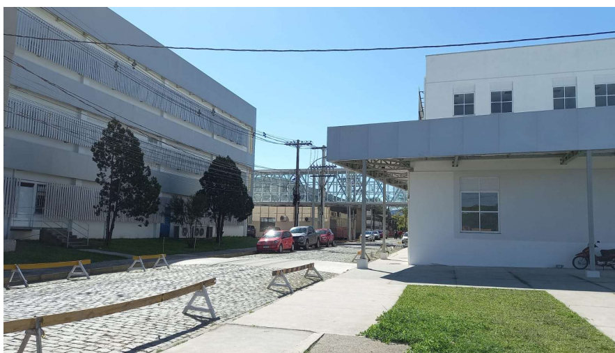
Obra da Central de UTIs (a esquerda) e Central de Laboratórios (a direita). Prédios interligados pela passarela, ao fundo.

A obra da Central de UTIs foi finalizada em 23 de dezembro de 2020. Em fevereiro e março de 2021, os pacientes das UTI Covid, Adulto, Pediátrica e Neonatal foram transferidos. A obra teve um investimento final de cerca de R$ 12 milhões. São 62 leitos divididos em dois andares e uma área total de 4.507,19M 2 . A UTI tem capacidade para 82 leitos.