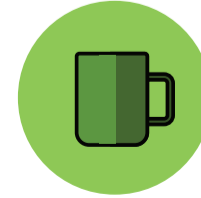
Objetos ou superfícies contaminadas