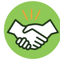
Toque ou aperto de mãos