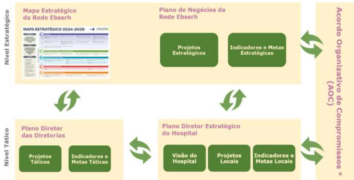
Figura 3: Modelo de Desdobramento da Estratégia da Rede Ebserh.